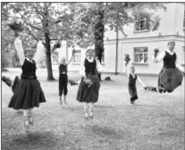
Pļaviņā pie norēķinu centra. Rugāju novada vidusskolas tautas deju kolektīvi.