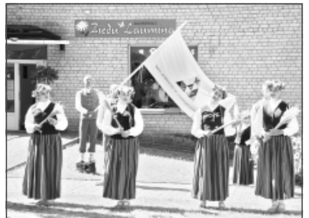
Balvu skvērā pie "Ziedu Laumiņas". Balvu Profesionālās un vispārīgglītojošās vidusskolas jauniešu deju kolektīvs "Kastanis".