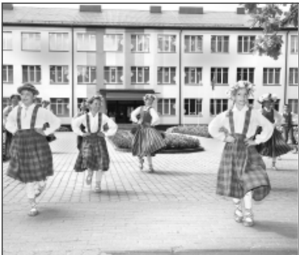
Pie Balvu sākumskolas. Balvu sākumskolas deju kolektīvs "Saulstariņi".