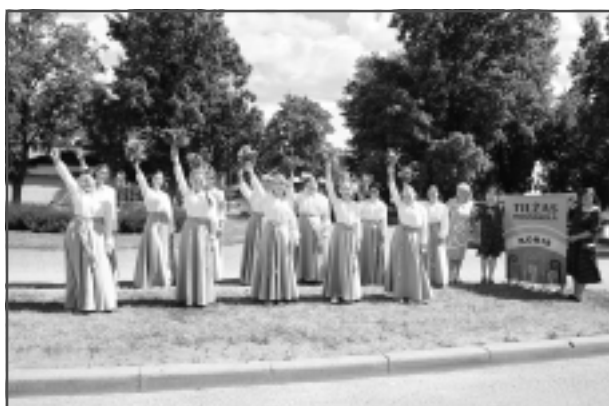
Pie Balvu ūdensrozes. Tilžas vidusskolas koris. Balvu Mūzikas skolas koris un vokālais ansamblis.