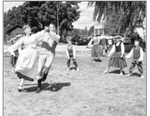
Antona Rimoviča skvērā. Ciemiņi sasveicinājās ar Balvu Kultūras un atpūtas centra deju kolektīvu "Balvu vilciņš", Kubulu kultūras nama un Stacijas pamatskolas tautas deju kolektīvu "Cielaviņa".