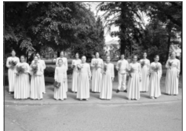
Krustojumā pie mākslas skolas. Balvu Mūzikas skolas koris un vokālais ansamblis.