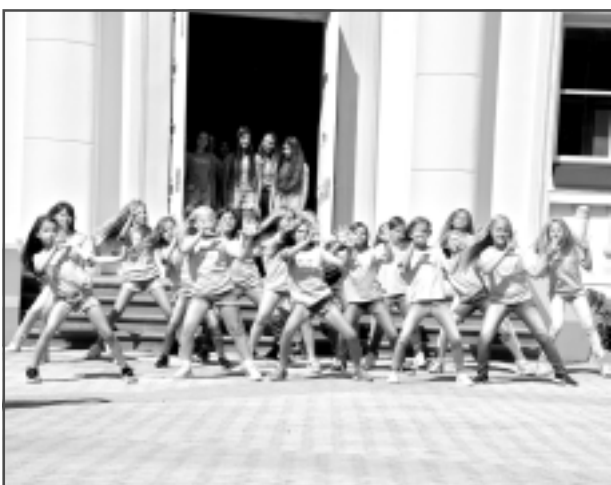
Kultūras un atpūtas centra laukumā. Mūsdienu deju studija "Terpsihora".