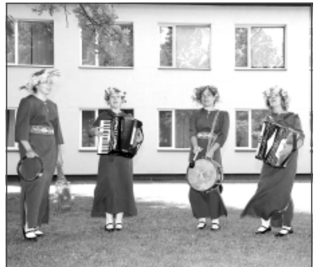
Partizānu ielā. Briēzuciema tautas nama folkloras kopa "Soldāni".