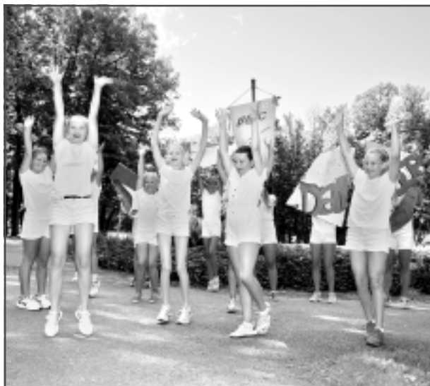
Pie vides objekta "Gaiss" pilsētas parkā. Mūsdienu deju studijas "DI-dancers" deju grupas "Rozīnītes" un "Juniori".