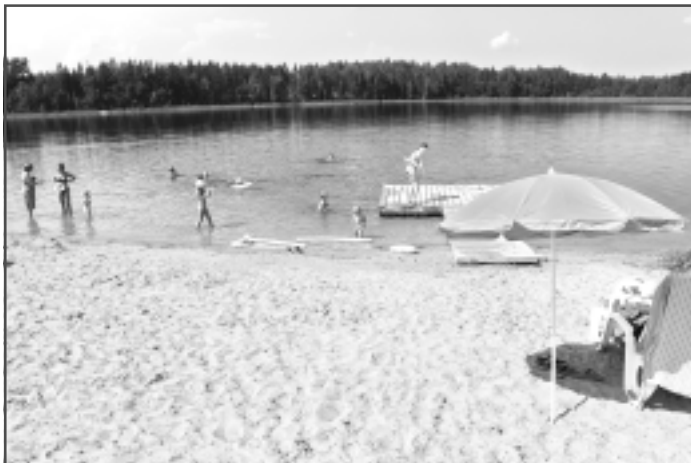
Skats uz peldvietu. Ar baudu siltajā ezera ūdenī vienā no šisvasaras karstajām dienām plūncājās ģimenes ar bērniem no kaimiņu pagasta.

Vienā no karstajām jūlija dienām Svētūnes pludmalī apmeklēja arī "Vaduguns", kur sastapa kuplu pulciņu gan lielu, gan mazu atpūtnieku, kas plūncājās ezera siltajos ūdeņos. Agita no Cēsīm, kura ar bērniem ciemojas Tilžā pie omītes, pludmalē bija ieradusies ar četriem bērniem, - diviem saviem un diviem māsas bērniem, un suni. Jaunā sieviete neslēpa, ka Tilžā nav vietas, kur peldēties bērniem, - upe tam nav piemērota, bet Ūdrenes ezerā nav pludmales. No Tilžas līdz Svētūnes ezeram sanāk paprāvs ceļš gabaliņš, aptuveni 15 kilometri, bet bērni ir centīgi strādājuši, ravējuši omītei dārzus, tāpēc peldēšanās godam nopelnīta. "Šonedēļ uz ezeru braucam katru dienu. Arī pērn braucām. Pagājušajā vasarā ezerā nebija laipas, no kuras var ieskrieties un ielēkt ūdenī, šogad jau ir. Vēl vakardien no ezera nebija izvāktas niedres, bet šodien, skatos, jau ir. Katru dienu pludmalē ir daudz cilvēku, bet brīvdienās cilvēku ir ļoti daudz, tāpēc brīvdienās uz ezeru nemaz nebraucam, jo tik lielā burzmā grūti