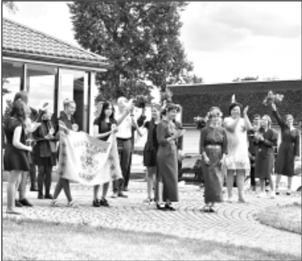
Bērzpils ielā pie "Ananasa". Baltinavas Mūzikas un mākslas skolas pūtēju orķestris, Baltinavas vidusskolas koris un Balvu Valsts ģimnāzijas koris.