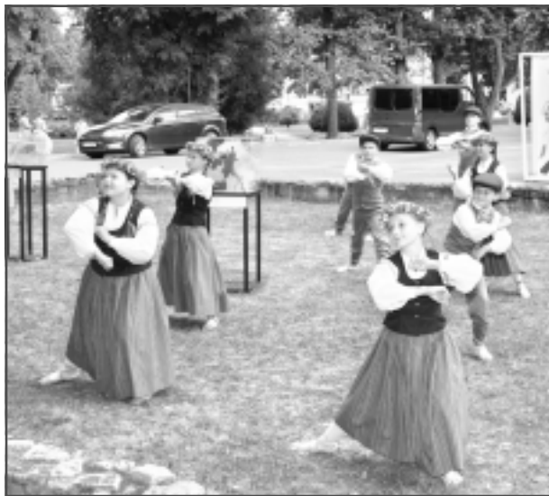
Pie mākslas skolas. Tilžas kultūras nama deju kolektīvs "Palazdīte".