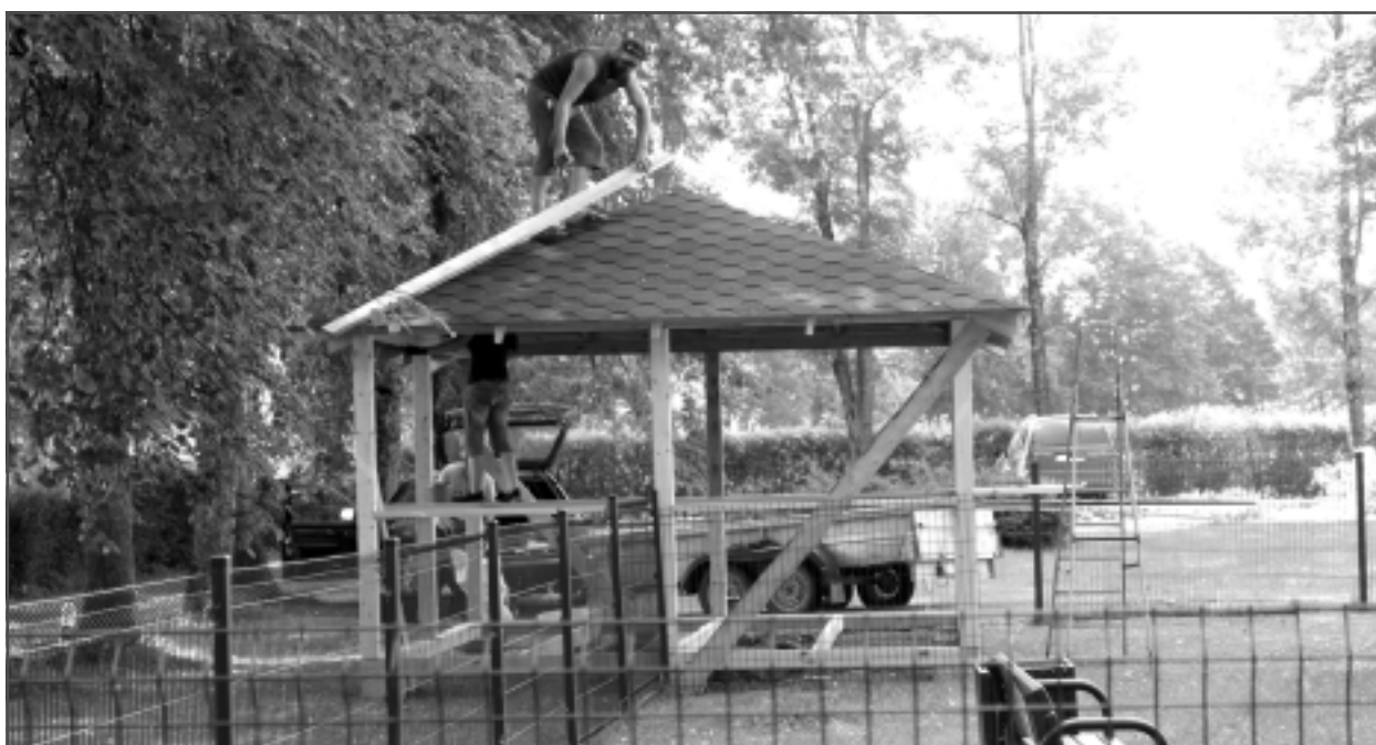
Top āra nojume. Atbalstot pirmsskolas bērnu vecāku ieceri, Baltinavas vidusskolas pagalmā šovasar top āra nojume, kas atradīsies līdzās rotaļu laukumam. Tagad, ja uznāks lietutiņš vai saulē kļūs karsti, bērni patvērumu varēs meklēt nojumē. Nojumes izbūvi veic fiziska persona, kas izraudzīta cenu aptaujā. Nojumi plānots pabeigt līdz 1.augustam.