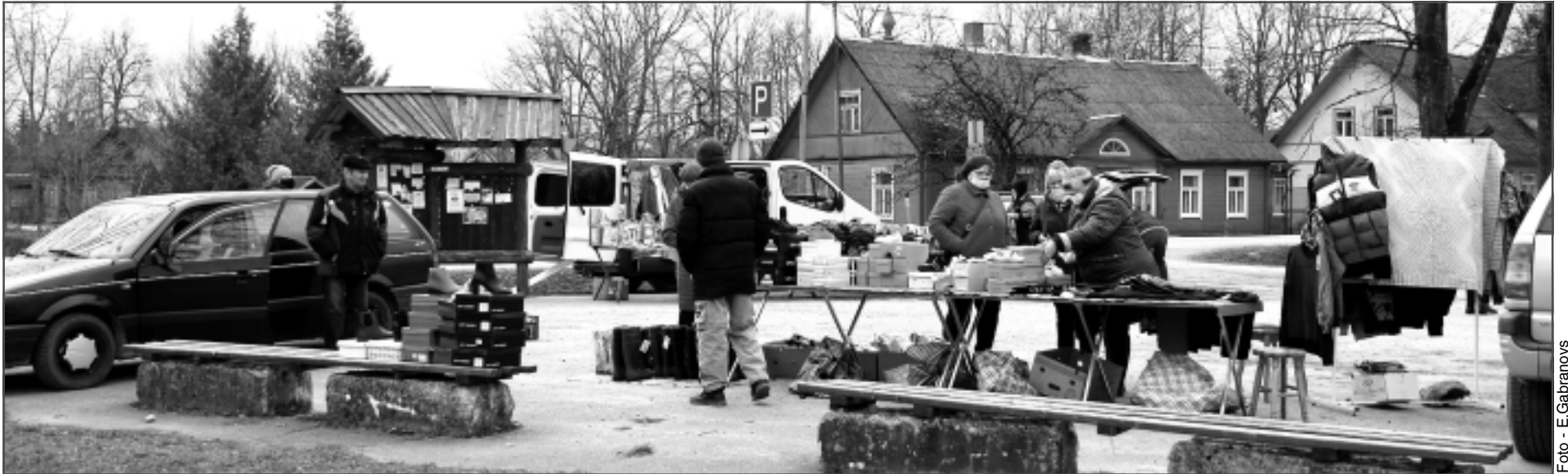
Baltinavas tirgus laukumā. Tirgus laukumā tirgus dienā savu preci piedāvāja lielākoties vietējie zemnieki un mājražotāji.

Pirmais pavasara gadatirgus mūspusē notika 15.aprīlī Baltinavā, kas bija darba diena. Pavasara gadatirgu 15.aprīlī baltinaviēši atjaunoja pirms vairākiem gadiem, jo vēsturiski, vēl pirmās Latvijas brīvvalsts laikā, tas noticis tieši šajā aprīļa datumā.