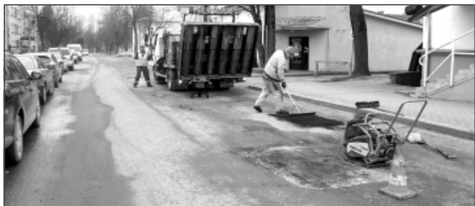
Lāpa bedrītes. Pagājušajā nedēļā remontstrādnieki lāpīja pa ziemu izveidojušās bedrītes Balvos, Teātra ielā.

Šobrīd tiks izsludināts iepirkums Tautas ielas un Vidzemes ielas posma pārbūvei. Šo ielu remontdarbiem ir izveidota tehniskā dokumentācija, tāpēc šobrīd ir iespējams veikt iepirkumu par būvdarbiem. Tāpat turpinās tehniskās dokumentācijas izstrāde Lauku ielas atlikušajam posmam, Bērzu ielas posmam starp Baznīcas un Jaunatnes ielu un Daugavpils ielas posmam starp Brīvības un Pilsoņu ielu.