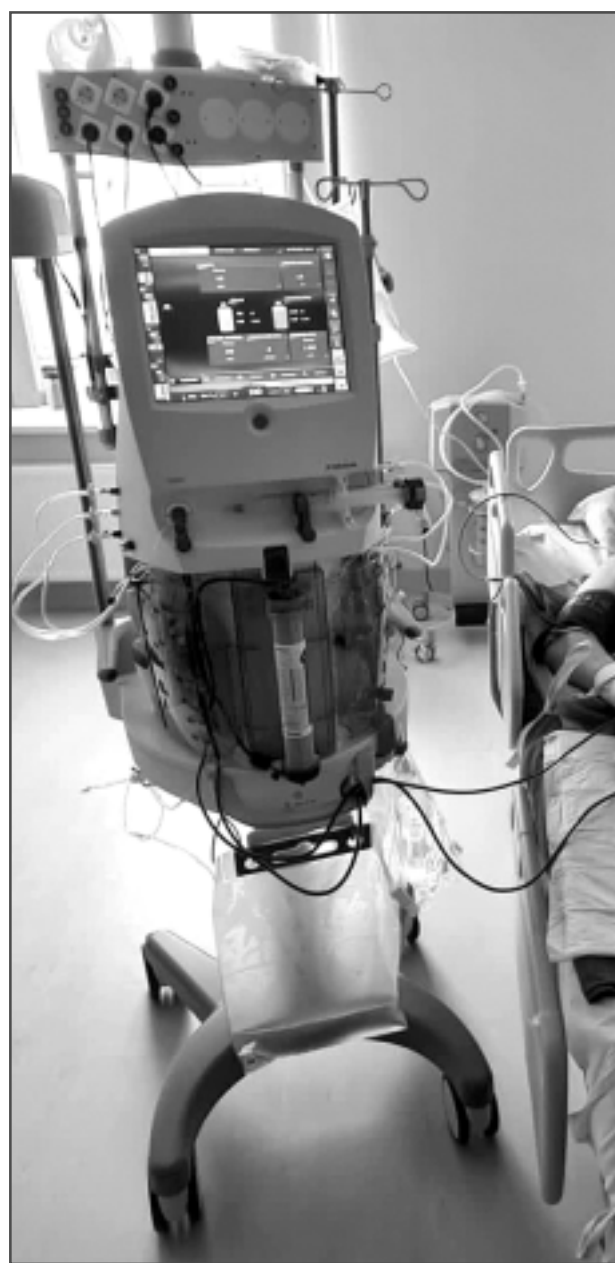
Jaunā iekārta. Nepārtrauktās nieru aizstājterapijas iekārta "OMNI" iegādāta no SIA "B.Braun Medical", kas veica arī praktiskās apmācības nodaļas personālam.

Jaunā iekārta "OMNI" sniedz iespēju piedāvāt pacientiem jebkura veida terapiju, kad tā nepieciešama, neatkarīgi no smaguma pakāpes stāvokļa. Mediķu darbs, kā uzskata speciālisti, tagad var ritēt operatīvāk un produktīvāk.