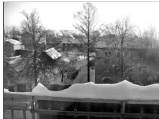
Rīts, divdesmit grādu sals.