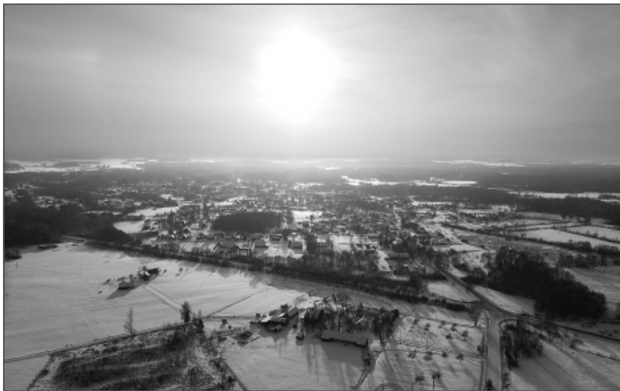
klusā ainava. Iesūtīja Andris Keiselis.

Katra mēneša labākās fotogrāfijas autors saņems balvu. Fotogrāfijas var iesūtīt pa pastu - Balvi, Teātra ielā 8, LV-4501, vai elektroniski - vaduguns@apollo.lv. Pie foto obligāti norādāms vārds, uzvārds (vēlams - tālrunis).