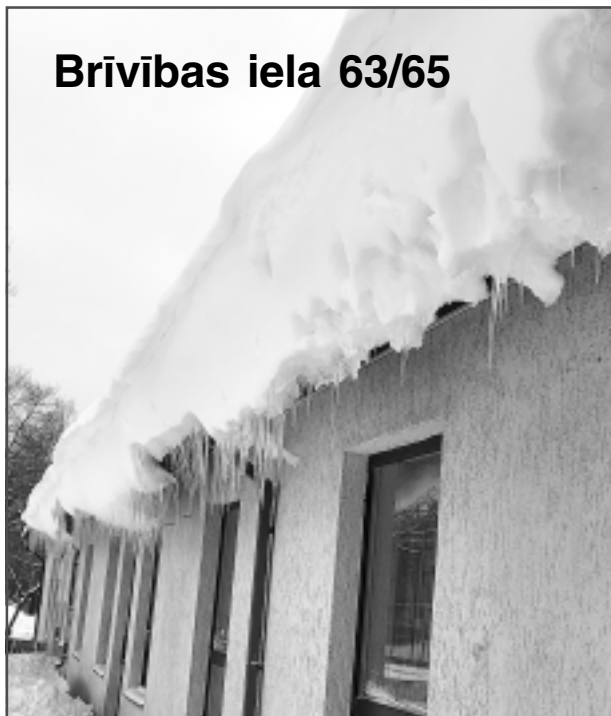
Brīvības iela 63/65

Kā redzams attēlā, pār ēkas jumtu bija pamatīgi pārsvērusies sniega sega. Turklāt tās galā izveidojušās lāstekas. Par to, ka šādā stāvoklī esoša ēka pilsētas centrā apdraud iedzīvotāju drošību, domājams, šaubu nevajadzētu būt nevienam. Šajā trešdienā laikraksta "Vaduguns" redakcijai saņēma ziņu, ka ceturtdien bīstamība tiks likvidēta. Tas arī tika operatīvi izdarīts, šobrīd pār šīs ēkas jumtu sniega segas un lāsteku vairs nav. Lai vai kā, šī raksta mērķis nav aicināt kādam piemērot sodu, bet ikvienam atgādināt par namīpašumu, zemesgabalu, pagalmu un piegulošo teritoriju uzturēšanu un kopšanu tā, lai tas ne tikai nesagādātu neērtības apkārtējiem, bet, pats galvenais, neradītu draudus apkārtējiem!