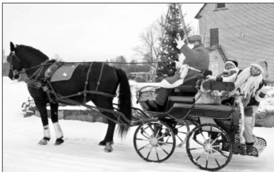
Ceļā pie mazuļiem. Ziemassvētku vecītis ar Rūķiem dodas ceļā pie Tilžas pagasta mazākajiem iedzīvotājiem.

Ķekatas Tilžas ielās. Ciema iedzīvotāji bija priecīgi redzēt ķekatas Tilžas ielās - izteikt novēlējumus Jaunajā gadā un saņemt tos pretī.