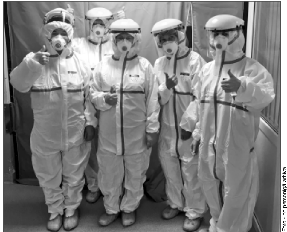
Kolēģu komanda. Šī brīža dzīves nopietnā situācijā mediķiem varam teikt tikai lielu paldies par viņu darbu un vēlēt izturību, prasmi pacientu atveseļošanas procesā.

-Prognozes nav, bet ir cerība, ka varbūt ar pavasari situācija mainīsies uz labu. Līdzīgi, kā parasti notiek ar gripu. Kaut kad tam visam