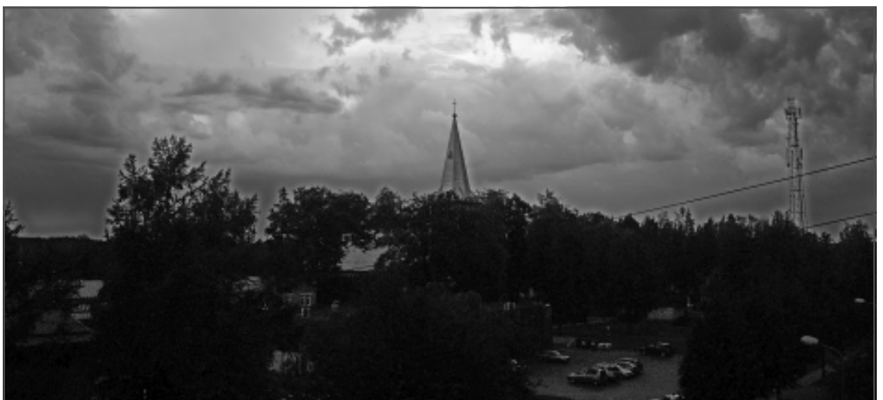
Simfonija debesis.

Par decembra labākās fotogrāfijas autoru atzīts RŪDOLFS KOZLOVS no Balviem ar fotogrāfiju "Balvu ezers", kas publicēta 15.decembrī. Pēc balvas griezties redakcijā.