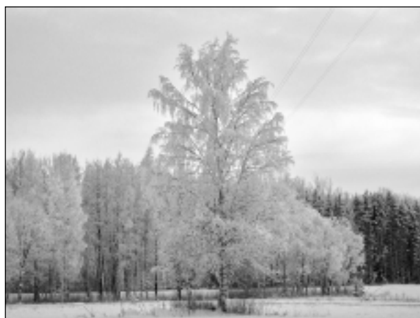
Sirmais laiks. Iesūtīja Zane Začeva no Kubuliem.

Katra mēneša labākās fotogrāfijas autors balvā saņems žurnālu komplektu. Janvāra tēma - "Sniegi sniga, putināja...". Fotogrāfijas var iesūtīt pa pastu – Balvi, Teātra ielā 8, LV-4501, vai elektroniski – vaduguns@apollo.lv. Pie foto obligāti norādāms vārds, uzvārds (vēlams - tālrunis).