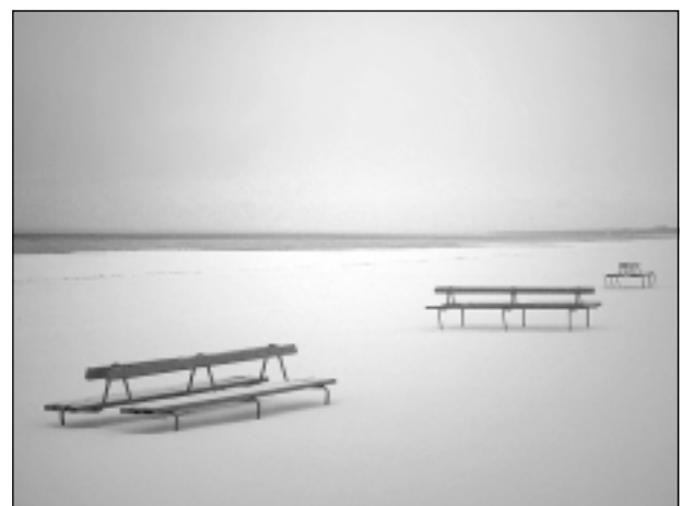
Sniga sniegi, putināja.