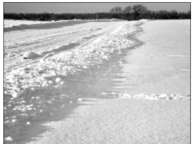
Ziemas ceļš. Iesūtīja Liene Circene no Bērzpils.