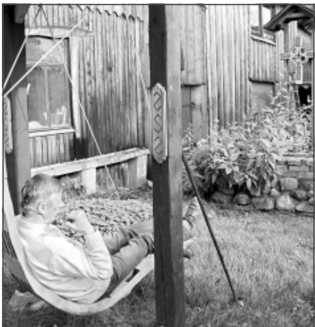
Meditācijas vieta. Pagalmā saimnieks ierīkojis speciālas šūpoles meditācijai, bet kokā iekārtā čuguna putras katla skaņas līdzinās baznīcas zvaniem un ne ar ko nav sliktākas par jogā izmantotajām meditācijas skanošajām bļodām. “No rīta izej, pastaigā, pasēdi, padomā un darbojies,” savu rīta rituālu īsi paskaidro darbnīcas saimnieks.