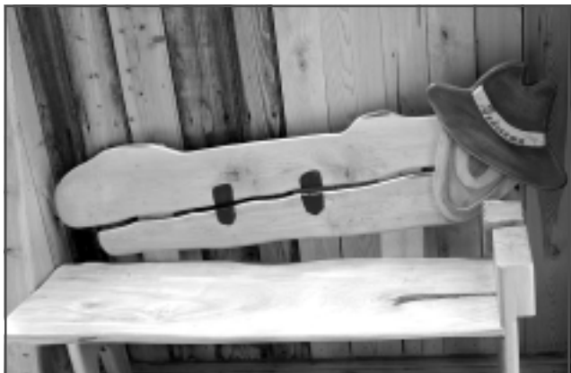
Iedvesmas soliņš. Šis soliņš gan nav vienīgā vieta, kur meistars gūst iedvesmu. Viņa galvenie radošie avoti ir mežs un svaigs gaiss: “Katram kokam ir sava enerģija. Piemēram, pirtiņā lāvu taisu no apses, jo tā paņem visu slikto, sienas - no liepas, kas līdzsvaro enerģiju, bet griestos iestrādāju osi, jo tas appaismo prātu. Tāpat kā no āderēm, arī no katra koka nāk savs starojums.”