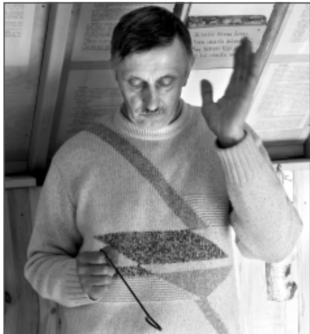
Rikstnieks. Viens no Jura talantiem ir prasme uziet āderes. Par to var pārliecināties arī darbnīcas apmeklētāji, jo izrādās, ka zem tās atrodas gan uguns, gan ūdens ādere.