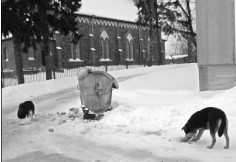
Suņu ēdnīca. Netālu no Balvu tirgus klaiņojoši suņi iekārtojuši savu 'ēdnīcu'. Skats nav no patīkamākajiem.