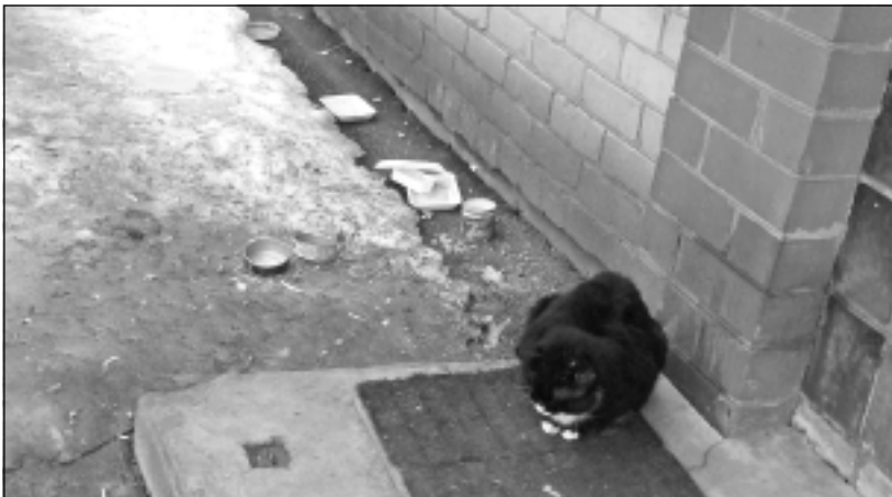
Kaķu barošanas vieta. Labsirdīgajiem kaķu barotājiem vajadzētu padomāt par to, ka šīs 'kaķu ēdnīcas' kādreiz vajadzētu arī uzņemt.

nistratīvo pārkāpumu kodeksa 106.panta 1.daļu "Dzīvnieku turēšanas, labturības, izmantošanas un pārvadāšanas prasību pārkāpšana", kas nosaka, ka pārkāpējiem (fiziskām personām) var izteikt brīdinājumu vai sodīt ar naudas sodu no 5 līdz 25 latiem. Savukārt Ministru kabineta "Suņu un kaķu turēšanas noteikumu" punkts 5.7 nosaka, ka pilsētās un citās apdzīvotās vietās, vedot dzīvniekus pastaigā, jāņem līdzi inventārs ekskrementu savākšanai (ja dzīvnieki tos atstājuši ārpus vietām, kas paredzētas dzīvnieku pastaigām), bet punktā 6.3 teikts, ka dzīvnieku saimnieki nedrīkst pieļaut, ka suņi un kaķi piemēro dzīvotām vai sabiedriskās telpas un apdzīvoto vietu teritoriju.