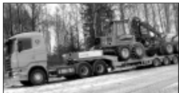
Treilera pakalpojumi. Tālr. 29113399.