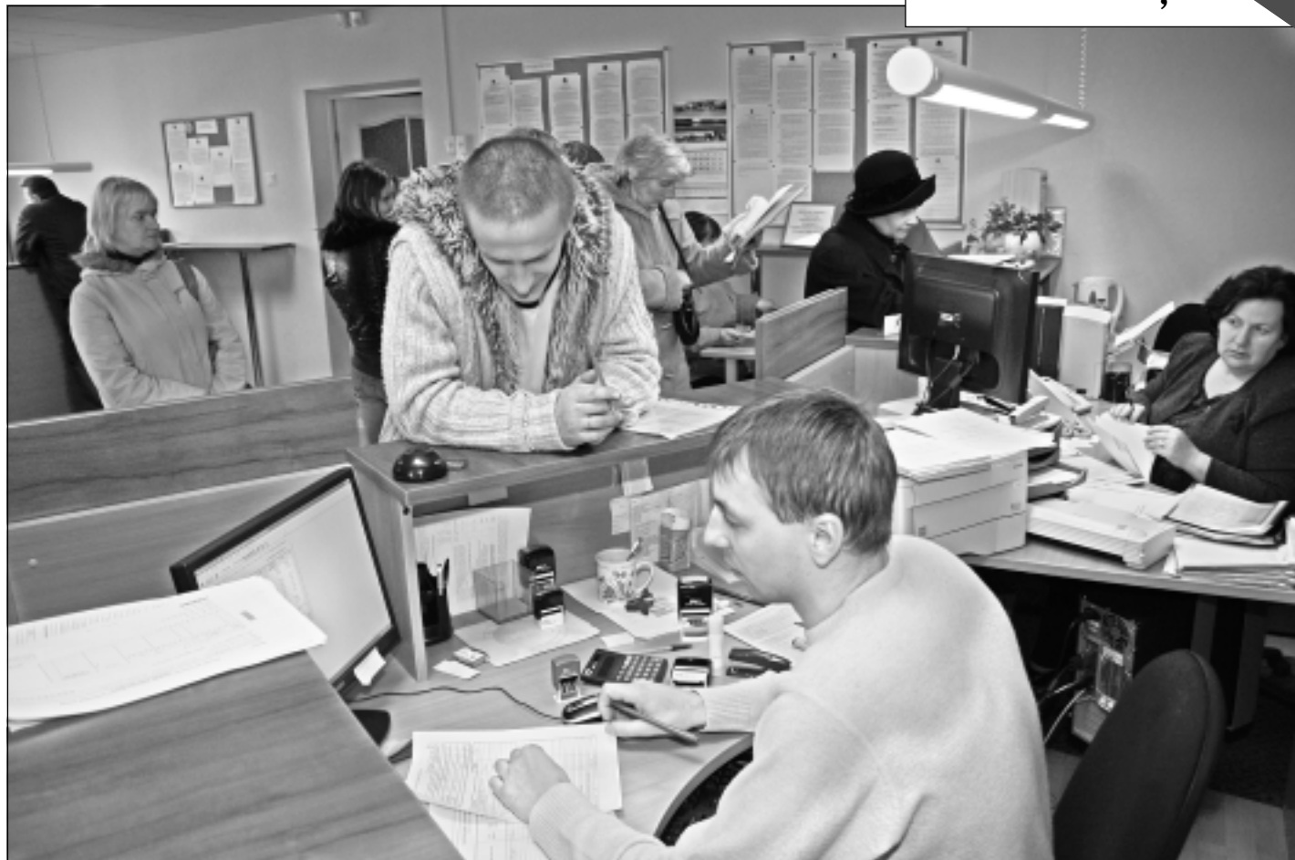
Respektē prasības. Rindas Valsts ieņēmumu dienesta (VID) Latgales nodokļu un muitas administrācijas Balvu nodaļā vēsta, ka cilvēki respektē ieņēmumu dienestu. "Ar nodokļiem jokot nevar," atzina klienti.

6.aprīlī redakcija strādās no pulksten 8 līdz 12