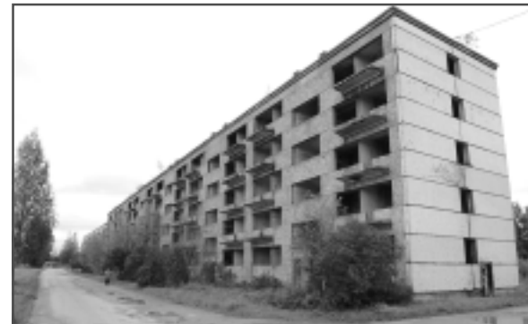
Pretstotī. Kuprovys pogosts na vēļtī var lepuotīs ar pīrmy nūsylytynuotū daudzdzeīvūkļu muojī. Dīvamžāļ tai rādā ruoduos tīkpat lels ī tukšs grausts.