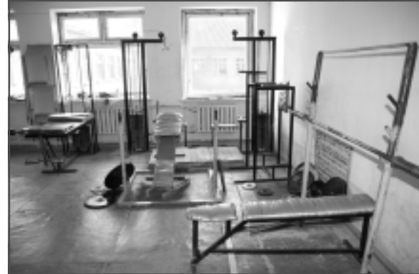
Vīta sportam. Vīneīguo telpa, kas skolā dorbojās kūpš tuos slīegšony, īr sporta zals, kurā pīejamī arī trenāžīerī.