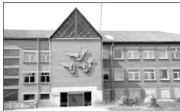
Kuprovys pamatškola. Tukšuok, leluo školy āka ar pogrobstuovā ī 1.stuovā aizmyurīetajīm lūgīm vys vēļ kolpoj kai atguodīnojumys par lobajīm laīkīm, kas reīz bīe.