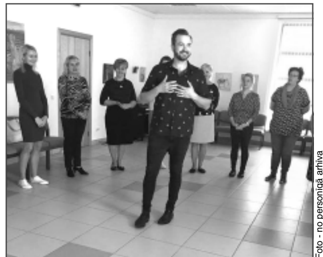
Improvizējam! Meistarklasēs aktieris lika visiem izmēģināt elpošanas vingrinājumus, lai varētu bez stresa kāpt uz skatuves vai iziet publikas priekšā.