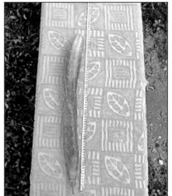
Lappusi sagatavoja E.Gabranovs