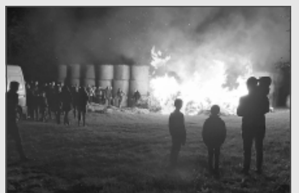
Bēdīgi, bet fakts. "Biju Upītes salmu estrādes aizdegšanās notikuma aculieciniece. Notikuma, jo par nelāmes gadījumu man, kā vairākumam, to ir grūti nosaukt! Kad sākās ugunsgrēks, es ar draudzeni bijām estrādes iekšpusē un liesmas ieraudzījām, kad tās sniedzās pāri ruļļu augšējai malai, jo uguns sākās no estrādes ārpusē. Cilvēki bez panikas varēja brīvi pamest estrādi, un viņu dzīvība netika apdraudēta. Daudzi, izsakot savu labo gribu, gāja palīgā iznest aparatūru un sāka gāzt salmu ruļļus uz ārpusi, tādējādi lokalizējot uguns izplatību, pirms atbrauc ugunsdzēsēji. Viņi arī bija operatīvi izsaukti, jo, kad es zvanīju uz 112 plkst. 22.36, man atbildēja, ka jau zinot un ir izbraukuši. Pirmā atbrauca ātrā palīdzība, bet viņiem tur nebija ko īsti darīt, jo cietušo nebija. Drīz pēc tam arī bija klāt ugunsdzēsēji, kas pārņēma brīvprātīgo uguns dzēšanu. Prieks bija lasīt, ja nešaubos, Latvijas radio 2 pasākuma rīkotāja Andra Slišāna teikto, ka, neskatoties ne uz ko, viņi ir spara un optimisma pilni nākamajam gadam... rīkot un organizēt mums jaunus pasākumus! Liels paldies viņiem!"