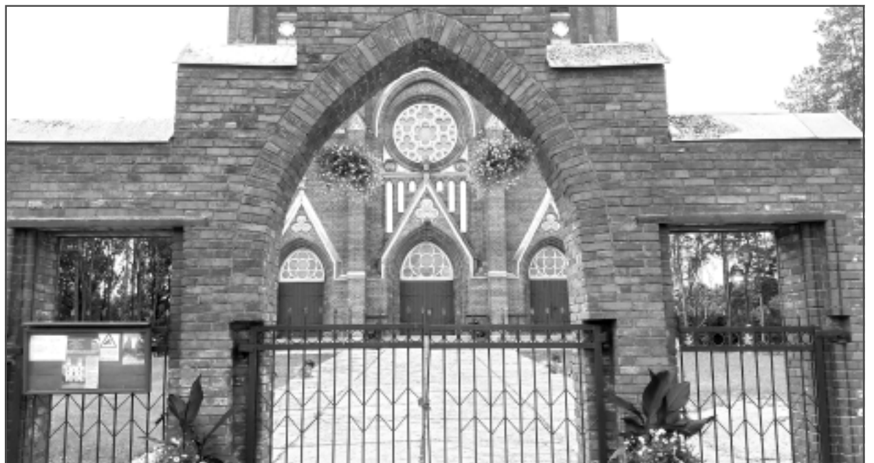
Ar mīlestību.

Katra mēneša labākās fotogrāfijas autors saņems balvu. Fotogrāfijas var iesūtīt pa pastu – Balvi, Teātra ielā 8, LV-4501, vai elektroniski – vaduguns@apollo.lv. Pie foto obligāti norādāms vārds, uzvārds (vēlams - tālrunis).