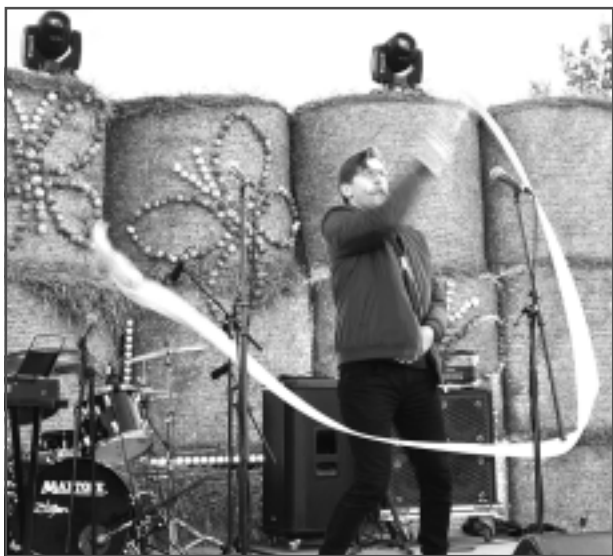
Mazbudžeta uznāciens. Pasākuma un TV raidījumu vadītājs Kozmens neskopojās ar jokiem. Viņš, no kabatas izvelkot, šķiet, tualetes papīra lentu, savu uznācienu nodēvēja par grandiozu, turklāt mazbudžeta. Tāpat Kozmens pastāstīja, ka bērnībā un jaunībā sapņojis kļūt par baznīckungu: "No gudrās vecmāmiņas uzzināju, ka baznīckungs nedrīkst precēties. Tad arī Kungam uzgriezu muguru."