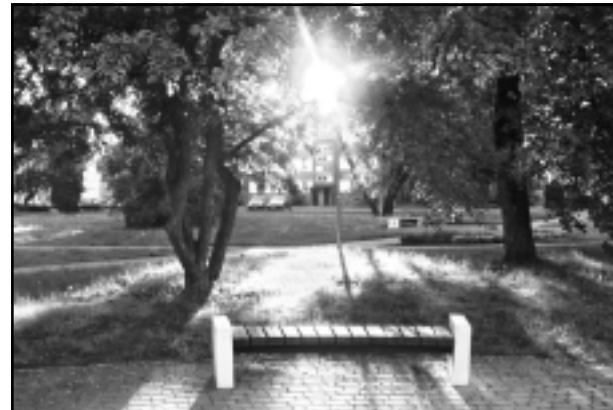
Kādreiz agrā rītā.