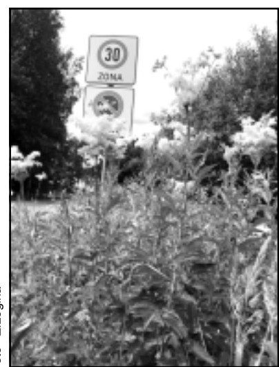
Ceļa zīme izeaugusi nezālēs. Uz ceļa, kurš ved uz privātmājām, ir zīme, ka šeit braukt drīkst tikai ar 30 km/h. Šoferi to droši vien ievēro, bet ievēro arī ko citu - ar zāli aizaugušos grāvjus.