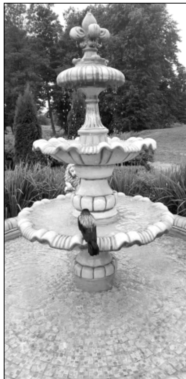
Pašizolācija. Iesūtīja Inese Dvinska.