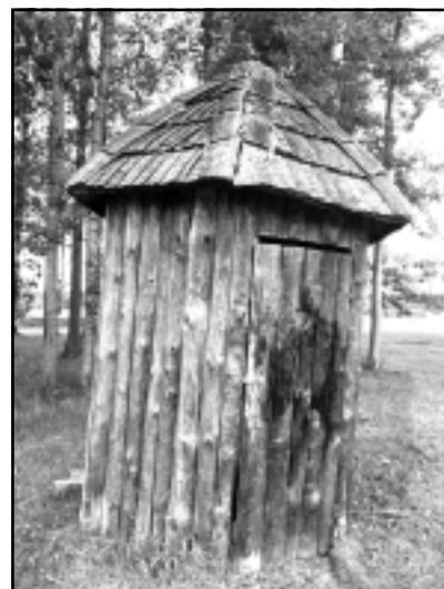
Tualete tīra, bet nedroša. To izmanto gan volejbola spēlētāji, gan peldvietas apmeklētāji, tāpēc sirdsmājiņa šeit ir nepieciešama.