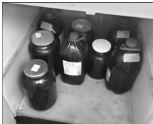
Tā nav sula. Policija konfiscēja 99,5 litrus kandžas.

Atgādinām, ka pēc Krimināllikuma 221.panta 1.daļas par alkoholisko dzērienu vai tabakas izstrādājumu nelikumīgu