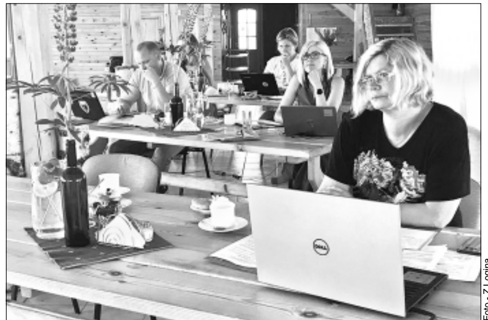
Garlaikoties nav laika. Semināra dalībnieki uz klātienes tikšanos bija ieradušies ar saviem portatīvajiem datoriem un mobilajiem telefoniem, lai teorētiskās zināšanas semināra pirmajā daļā pielietotu praktiski tā otrajā daļā.

un bilde centrālajam objektam proporcionāli jāaizņem lielākā fotogrāfijas daļa, savukārt, piemēram, debesīm - tikai trešdaļa. Izteiksmīgiem mākoņu kadriem ieteicams izmantot šo principu apgrieztā veidā. Ja ir izvēle, fotografēt ārā vai iekštelpās, labākas bildes jebkuros laika apstākļos sanāks ārā. Lai būtu veiksmīga iekštelpu bilde, objektam jāstāv ar skatu pret gaismu. Jāuzmanās no nejaukām ēnām uz cilvēku sejām, jāskatās, kāds būs bildes fons. Semināra dalībnieki devās dabā un fotografēja dažādus objektus "Rūķišu" apkārtnē, lai pēc tam izanalizētu paveikto kopā ar lektori.