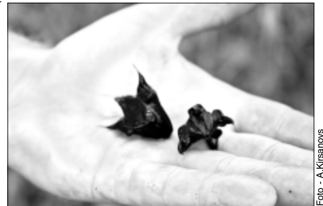
Ass kā ezis. Pērnos ezerriekstus ūdens izskalo krastā. Tie ir asi kā kastaņi vai eži.