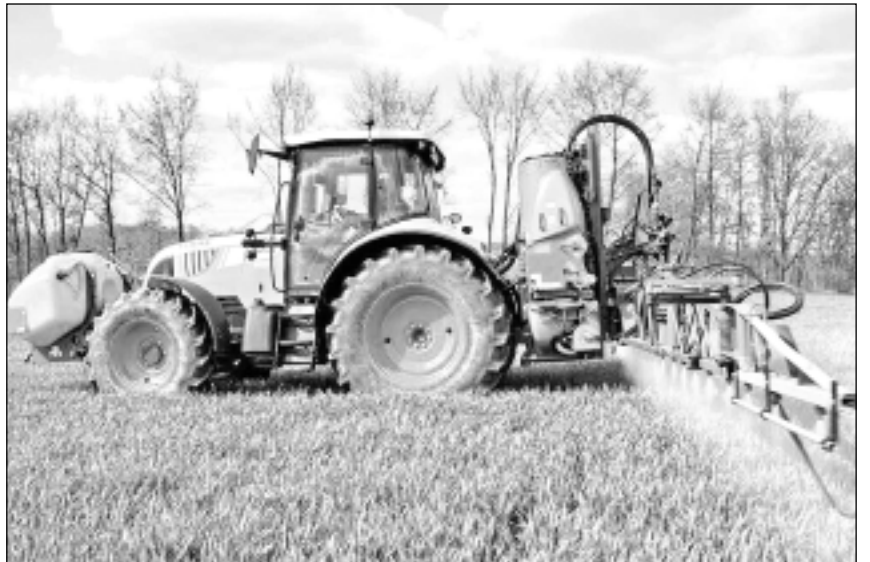
Būtiski ievērot. Bites ir būtiski lauksaimnieku palīgi – kultūraugu apputeksnētāji, tāpēc ar to klātbūtni jāreķinās vienmēr, bet it īpaši gadījumos, ja sējumos vai stādījumos tiek lietoti insekticīdi, kā arī, ja blakus saimniecībās ir bišu dravas.

Par ko lielākoties sūdzas? Ka kultūraugu ziedēšanas laikā lietoti fungicīdi, herbicīdi, papildmēslojums, kuru lietošanai nav nepieciešami specifiski ierobežojumi bišu un citu ap-