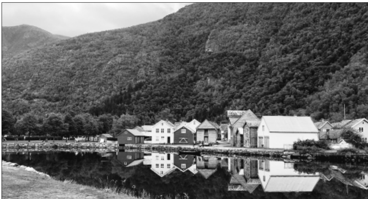
Troļļu zemē Norvēģijā. Iesūtīja novadniece Ieva.

Katra mēneša labākās fotogrāfijas autors saņems balvu. Fotogrāfijas var iesūtīt pa pastu - Balvi, Teātra ielā 8, LV-4501, vai elektroniski - vaduguns@apollo.lv . Pie foto obligāti norādāms vārds, uzvārds (vēlams - tālrunis).