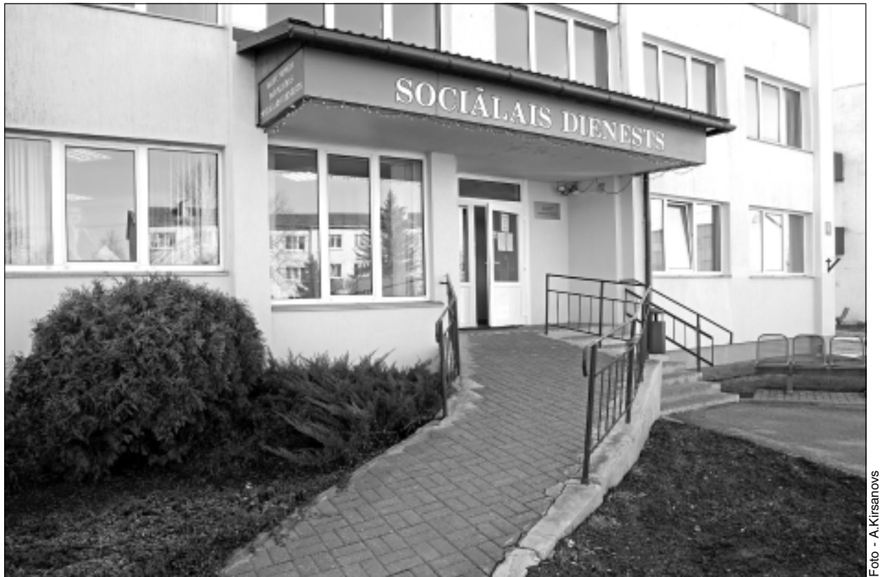
Strādā ārkārtas režīmā. Sociālais dienests kopš 16.marta ir pārtraucis klientu apkalpošanu klātienē, piemērojoties krīzes situācijas nosacījumiem.

-Darbs jaunajos apstākļos prasa radošu pieeju un nestandarta risinājumus, reaģējot operatīvi. Darba apjoms nemazinās, jo visi Sociālā dienesta pakalpojumi tiek sniegti.