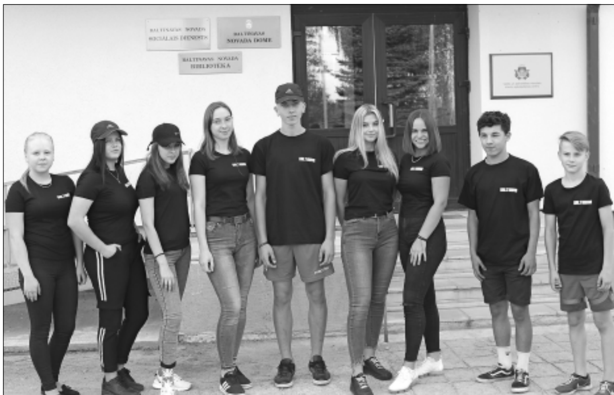
Uz kalendāra vāka. Baltinavas jaunieši izdevuši 2020.gada galda pārlietamo kalendāru, uz kura titullapas redzama daļa aktīvāko jauniešu, kuri pērn iesaistījās pasākumu organizēšanā. Skaisti!

Kādi ir nākotnes plāni? Vai tiks meklētas iespējas iesākt turpināt?