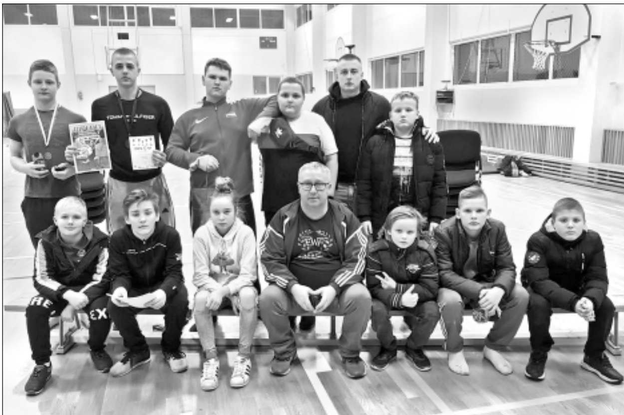
Ar medaļām un diplomiem. Balvu Sporta skolas svarcēlāju un treneru kopbilde pēc sacensībām Tartu, Igaunijā.