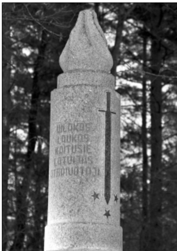
Jaškovas kapos Viļakā. Iesūtīja Pēteris no Viļakas novada.

Katra mēneša labākās fotogrāfijas autors saņems balvu. Fotogrāfijas var iesūtīt pa pastu – Balvi, Teātra ielā 8, LV-4501, vai elektroniski – vaduguns@apollo.lv . Pie foto obligāti norādāms vārds, uzvārds (vēlams - tālrunis).