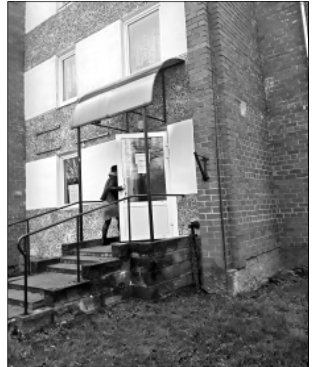
Jaunā adrese Balvos. Sākot ar šo gadu, SIA "Pilsētvides serviss" klientu centrs mainījis atrašanās vietu. Jaunā adrese Balvos ir Tīrgus iela 3, kas ir trīsstāvu dzīvojamais nams.

-Saistībā ar dabas resursu nodokļa pieaugumu 2020.gadam, sākot ar 1.janvāri, nešķirotu sadzīves atkritumu apsaimniekošanas maksa Balvu novadā ir noteikta 20,58 EUR/m 3 (ar PVN 21%) iepriekšējo 20,06 EUR/m 3 (ar PVN 21%) vietā.