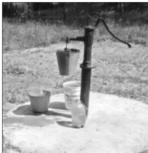
Mastarīga. Ūdens ņemšanas vieta Mastarīgas kapos.

Divu projektu īstenošana 5. rīcībā "Sporta, tūrisma, atpūtas un brīvā laika infrastruktūras izveide" noslēgsies 2011.gadā. Lazdulejas pagasta lauku iedzīvotāju biedrība "Lazduleja" īsteno projektus "Sakopta vide un aktīvs atpūtas dzīvesveids Lazdulejas pagasta iedzīvotājiem" un sporta klubs "Rugāji" - "Bērniem un jauniešiem piemērotas mototrases izveide un aprīkojuma iegāde Rugāju novadā".