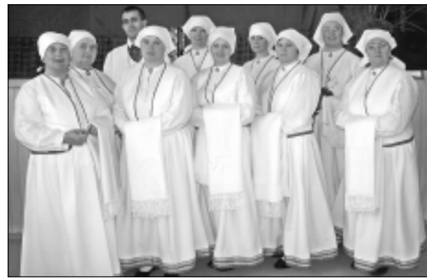
Vectilžas "Saime". Jaunajos taututēros Vectilžas folkloras kopa "Saime".