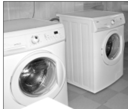
Veļas mazgātuve Rugājos. Iegādātās jaunās veļasmašīnas.