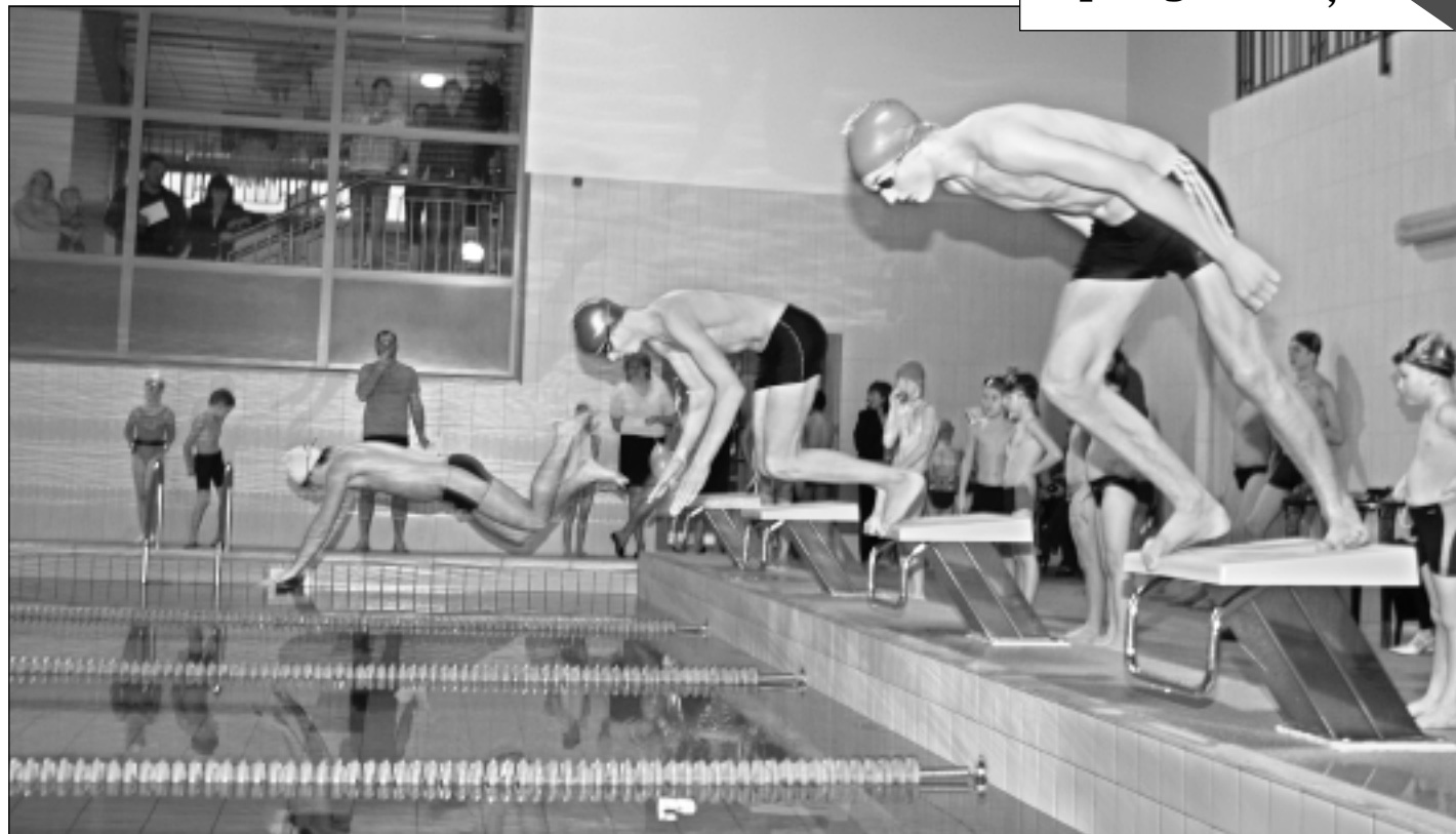
Starta lēcieni. Sporta skolas audzēkņi sacentās brīvajā stilā un kraulā uz muguras 25 un 50 metru distancēs.

11.decembrī pulksten 14 Balvu pamatskolas sporta zālē notiks kārtējā Latvijas 1.līgas čempionāta volejbolā spēle starp volejbola klubiem "Balvi" un "Ventpils".