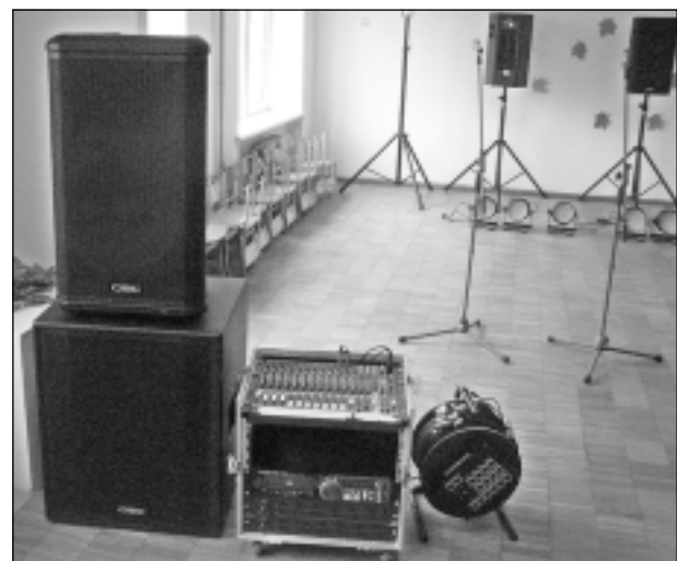
Iegādātais aprīkojums. Viļakas pūtēju orķestra atbalsta biedrības realizētais projekts.