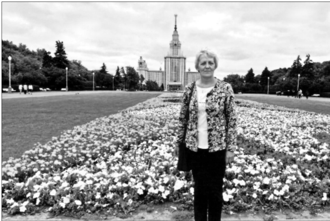
Gandrīz kā Latvijā. Pēc šķirnēm puķu stādījumi Maskavā īpaši neatšķiras no Latvijas dobēm, taču to apmēri ir milzīgi. Ziedi ir dažādās krāsās, kas pāriet no vienas otrā, un dažāda izmēra, sākot no mazākiem līdz lielākiem.