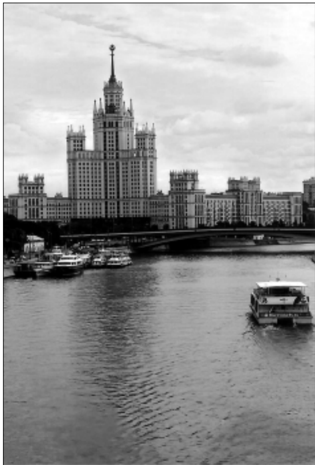
Skats uz pilsētu. Vizinoties ar kuģīti pa Maskavas upi, iespējams baudīt pilsētas panorāmu no dažādiem skatu punktiem. Upes krastos vērojama dažāda ēku arhitektūra.