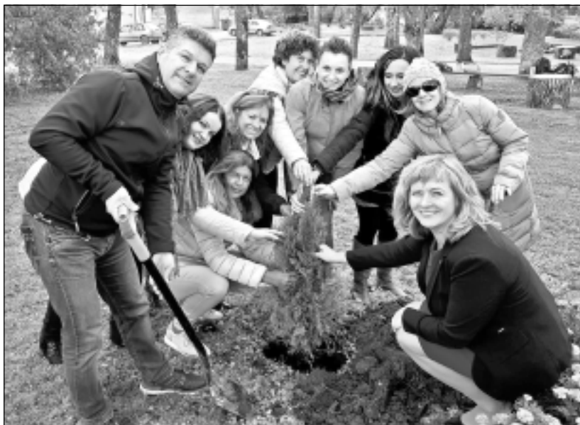
Lai planēta vēl zaļāka. Par ārzemju ciemiņu viesošanās rugājiešiem atgādinās ārzemnieku iestādītais Laimas koks pie Rugāju novada vidusskolas.