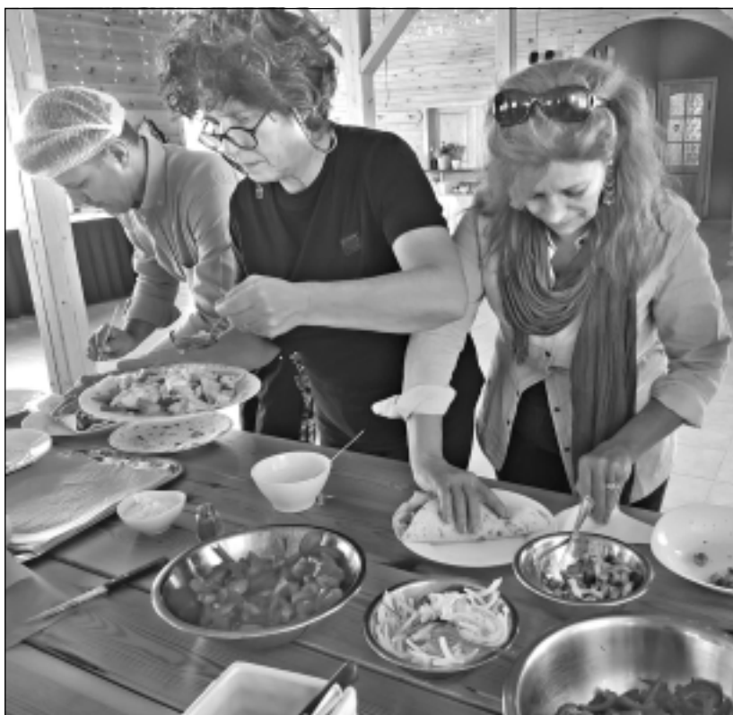
Veselīgi un gardi. No Rugājiem ārzemju viesi mājās aizvedīs vairākas veselīgu ēdienu receptes.

ka radošo darbu konkurss "Mans skaistais dārzs". Kopumā konkursam skolēni iesniedza 73 zīmējumus, fotogrāfijas un citas tehnikās veidotus darbus. Katru konkursa dalībnieku apbalvoja ar sēklu paciņu savam dārzam, savukārt galveno balvu ieguvēji priecājās par viņiem pasniegtajiem tulpu sīpoliem.