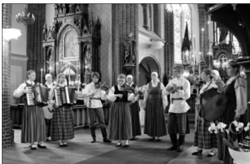
Viļakas katoļu baznīcā. Dzied folkloras kopa "Upīte". Šajā sirsnīgajā koncertā piedalījās arī Lietuvas un Baltkrievijas folkloras kopas.

Koncertē visi. Vakarā pie Upītes tautas nama uz lielās skatuves noslēguma koncertā piedalījās visi festivāla dalībnieki. Ar interesantām dziesmām un jaukām dejām priecēja arī baltkrievu folkloras kopa "Krynica".