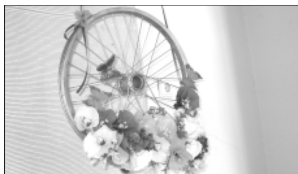
Priecē noformējums. Katrā izglītības iestādē, gatavojoties septembrim, ir domāts un daudz darīts, lai ar kosmētiskajiem remontiem un krāšņo noformējumu radītu ikvienam apmeklētājam svētku noskaņojumu. Īpaši košās krāsās rotātas telpas bērnudārzos, arī PII "Ieviņa", kas liecina par darbinieku radošo izdomu un ieceru īstenošanu.