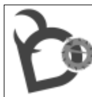
Balvu novada logo

Pieņēma saistošo noteikumu "Par Balvu novada un Balvu pilsētas simboliku" projektu, kas papildināti ar jaunām nodaļām par Balvu novada logo un moto aprakstu un to lietošanu, kā arī paredzēta atbildība par logo un moto nepareizu lietošanu. Balvu novada un Balvu pilsētas ģerboņus, karogus, logo un moto, to attēlus vai elementus drīkst izmantot komercsabiedrības, biedrības, nodibinājumi un privātpersonas atribūtikas, suvenīru, rūpniecības, pārtikas, sadzīves un tml. priekšmetu noformēšanā un ražošanā, preču zīmēs, nosaukumos vai noformējumos tikai ar Balvu novada pašvaldības Būvvaldes atļauju, izņemot gadījumus, kad simboliku atveido ierobežotā apjomā bezpeļņas nolūkos, t.i., personiskām vajadzībām, mācību nolūkos, bibliotēkās, muzejos un arhīvos, kā arī informatīviem mērķiem, piemēram, veidojot tādu aktuālo notikumu apskatu, kurā izmantota simbolika. Par nepareizu lietošanu paredzēts administratīvais sods – brīdinājums vai naudas sods līdz EUR 75.