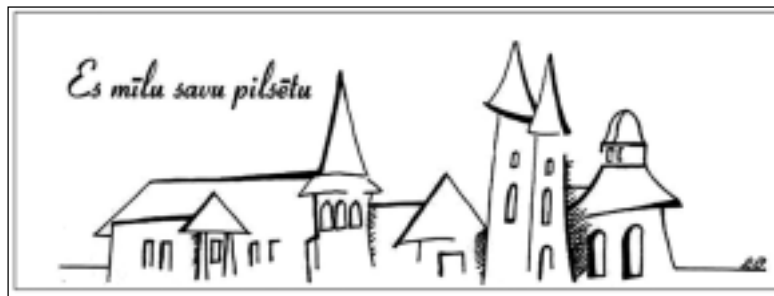
Balvu pilsētas logo