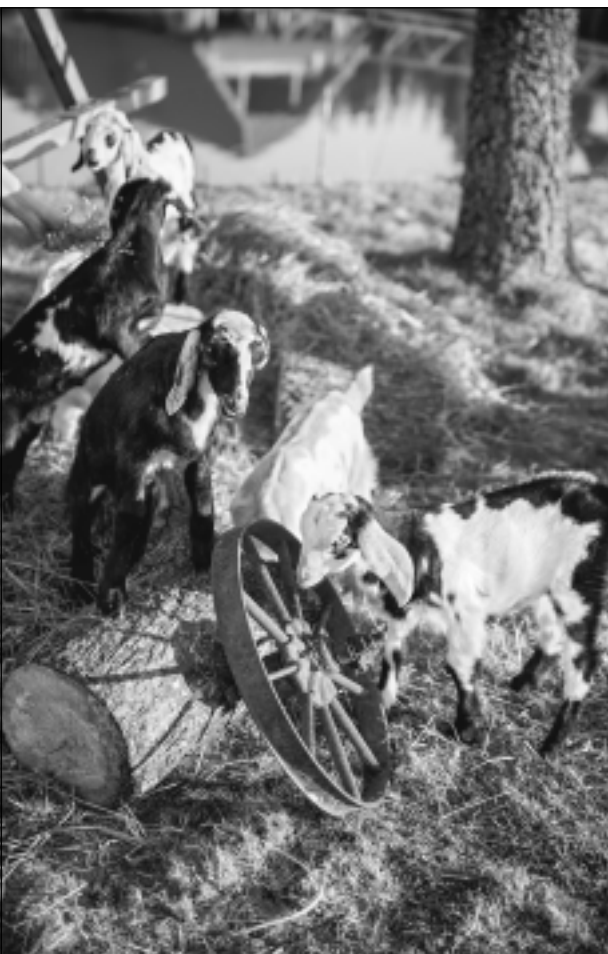
Dzīvnieku bariņš. Ne vien spītīgi, bet arī komunikabli un gudri dzīvnieki, kuri saviem saimniekiem ikdienā atklāj jaunas sava rakstura nianšes.