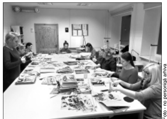
Mācās saskaņot krāsas. Viens no uzdevumiem tērpu stila mācībā bija, izgriežot dažādu krāsu tērpa detaļas no žurnālu fotogrāfijām un pareizi saskaņojot krāsas, izveidot jaunu imidžu jeb ārējo tēlu.