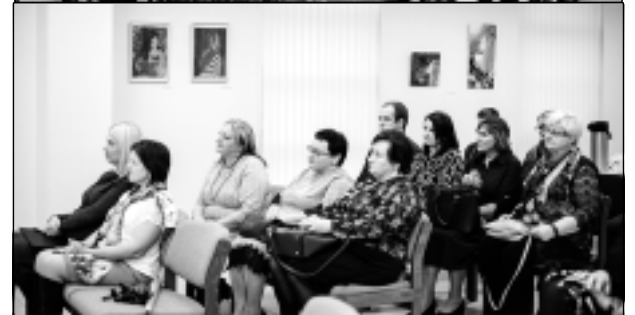
Izstādes dalībnieki un apmeklētāji.