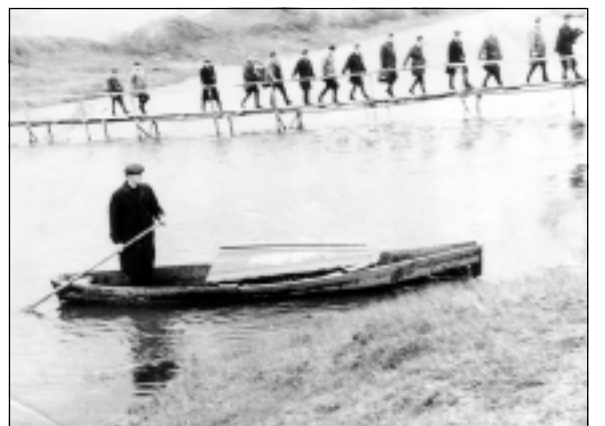
Gājiens uz kapiem. No Solas, kura atradās aiz lčas upes un kuru ar pārējo Bērzpils daļu agrāk savienoja vien laipa, ko ik pavasari palu ūdeņi aizskalvoja, mirušos uz kapsētu zārkā veda ar laivām. Pārējie bērnieki ceļu mēroja kājām. Lai pu pēc palie vienmēr būvēja no jauna.