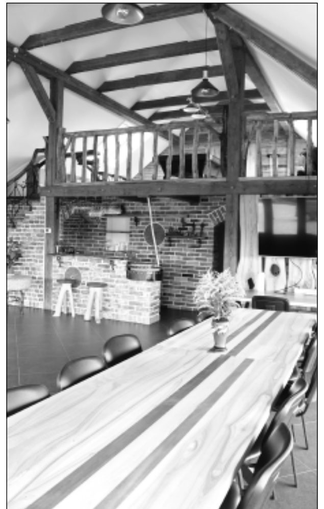
Šeit sākās graudu ceļš. Jaunā semināru zāle atgādinās laiku, kad šeit bija pirmie seši graudu arodi. Nu semināru zāli var dēvēt arī par goda vietu, par sākumu saimniecības graudu ceļam.