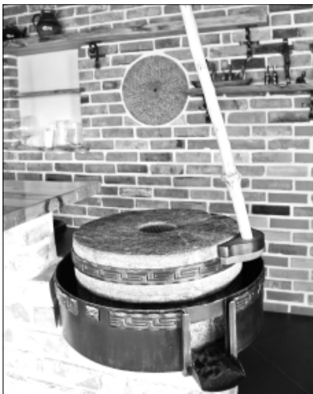
Funkcionējošs dzirnakmens. Tas ir kā simbols vietai, kur savulaik pirms 25 gadiem atradās graudu klēts.