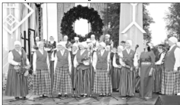
Vecāki par pieciem gadiem. Kad festivāla vadītāji, piesakot senāko etnogrāfisko ansambli Ziemeļlatgalē, teica, ka tam ir 35 gadi, briežuciemieši (foto) pavēstīja: “Par pieciem gadiem vairāk.”