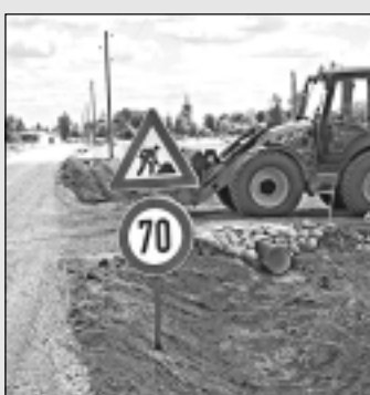
Mazie novadi apsvie-dīgāki.