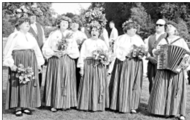
Uzsāk dziesmu. Stundu pirms oficiālā koncerta savas dziesmas izdziedāja Viļakas novada kolektīvi, tostarp Žīguru folkloras kopa “Mežābeles” (foto).