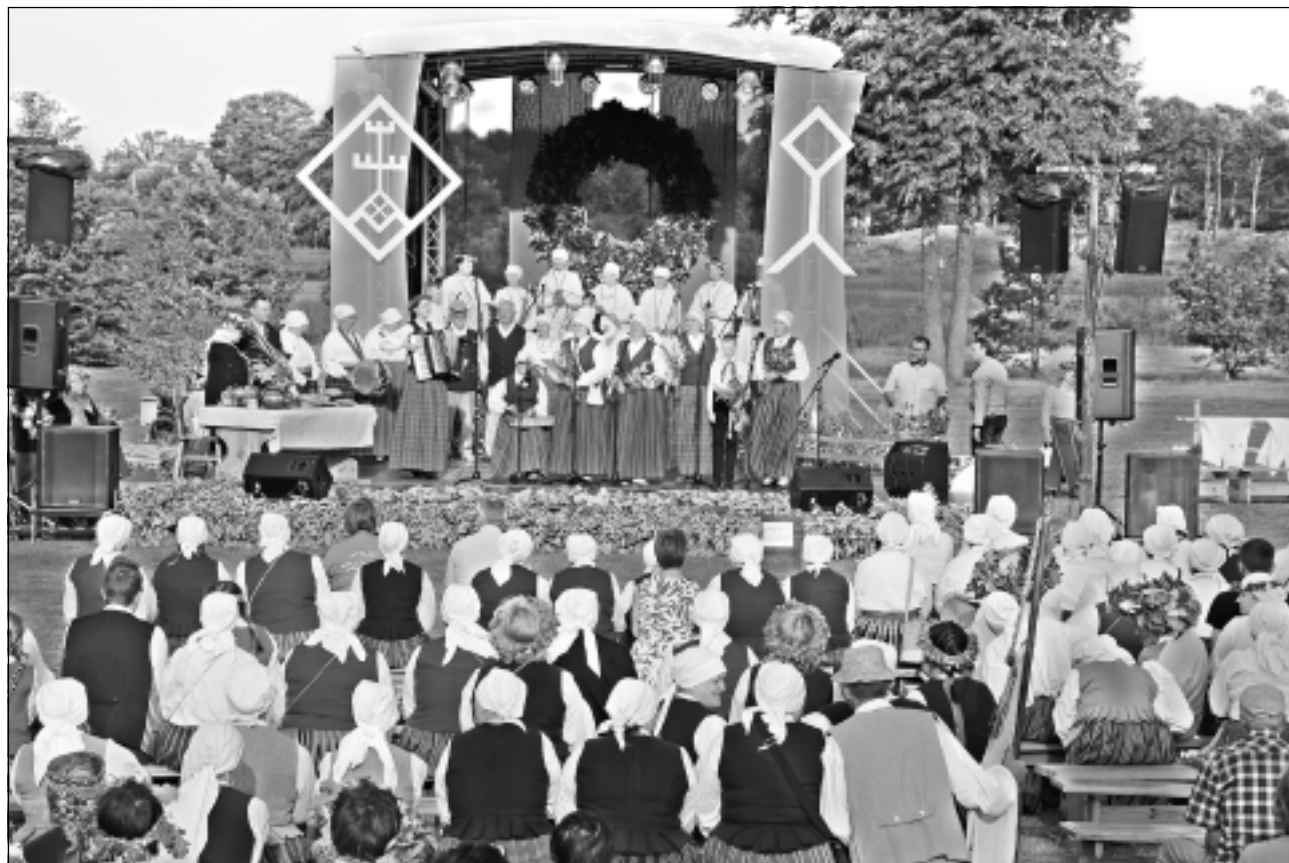
Iespaidīgi! “Baltica 2018” noslēguma koncertā uz skatuves kāpa 21 vieskolektīvs.