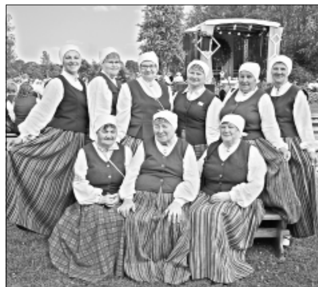
Foto piemiņai. Folkloras kolektīvi citīgi fotografējās, tostarp bērzglalieši no Rēzeknes novada. “A vai “Vaduguni” būsim?” jautāja ciemiņi.