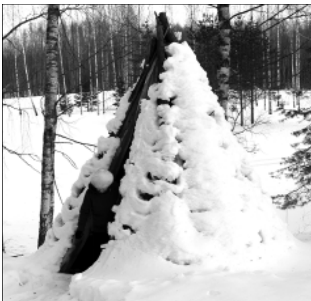
Brīvā dabā. Zils debesjums, pēcpusdienas saule pirms rieta, sniega pikas un bezvējš. Pārliecinājāties, ka marta dienām ir īpaša noskaņa.