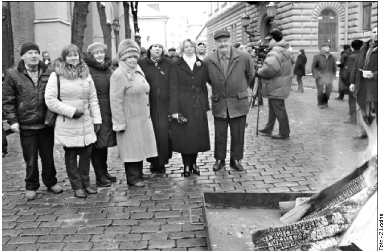
Pie ugunsкура Saeimas nama pagalmā. Balvu novada cilvēki kopā ar Saeimas priekšsēdētāju Ināru Mūrnieci.