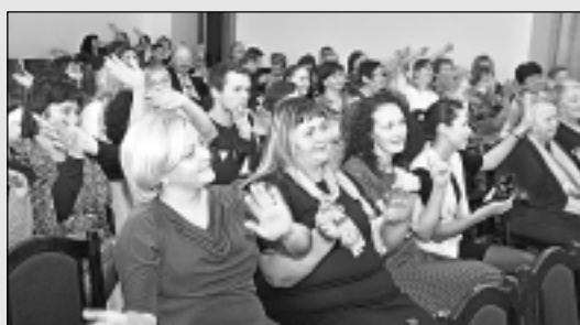
Paldies vārdu pēcpusdienu Balvos.