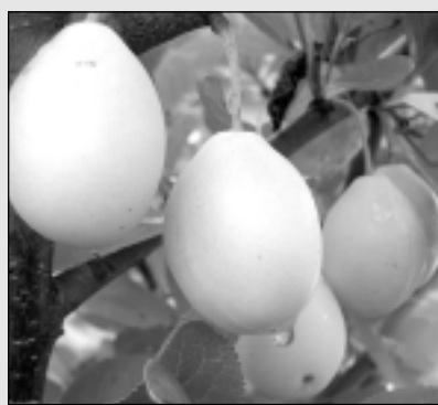
Plūme ar bērības atmiņām.