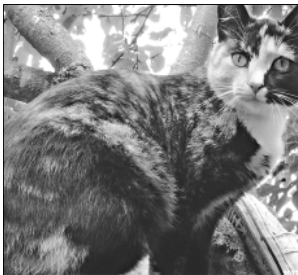
Esmu šeit! Iesūtīja Daniels Kivkucās no Balviem.

Katra mēneša labākās fotogrāfijas autors saņems balvu. Fotogrāfijas var iesūtīt pa pastu – Balvi, Teātra ielā 8, LV-4501, vai elektroniski – vaduguns@apollo.lv. Pie foto obligāti norādāms vārds, uzvārds (vēlams - tālrunis).