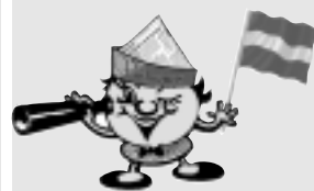
Līdz LATVIJAS simtgadei 389 dienas!