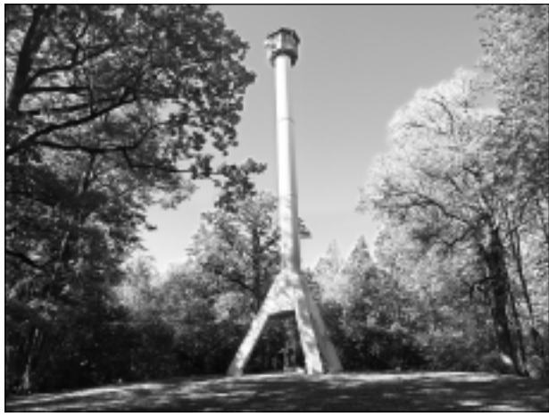
Zilajā kalnā.