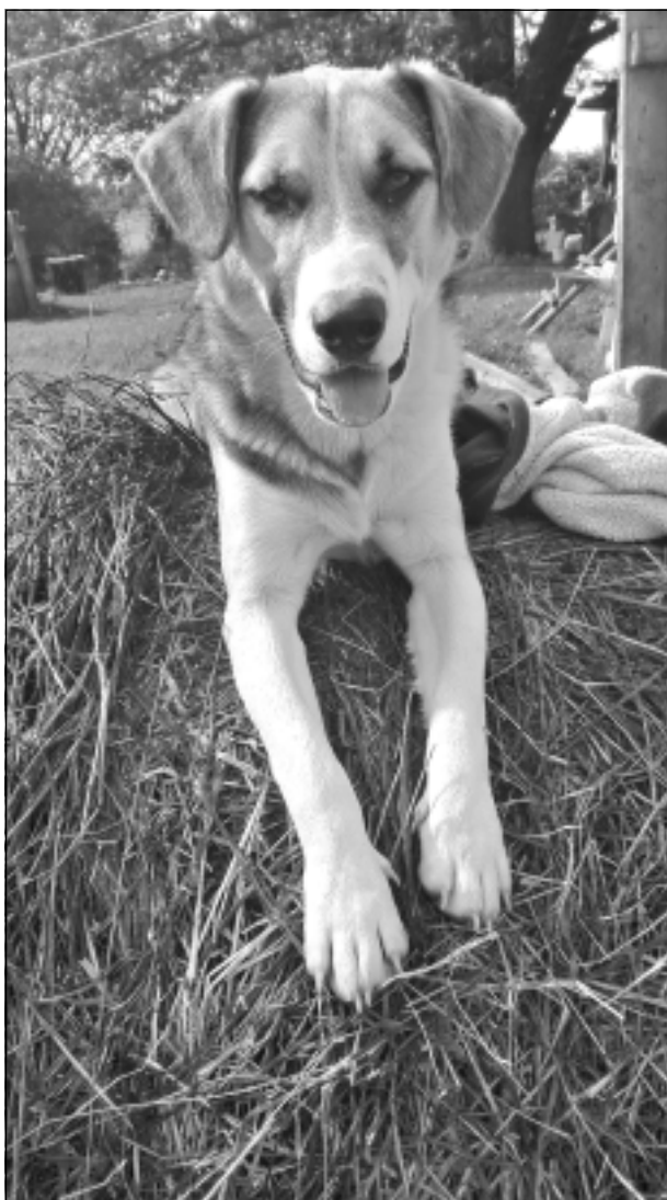
Ne pats ēdišu, ne citam došu! Iesūtīja Zintis Dvinskis.

Katra mēneša labākās fotogrāfijas autors saņems balvu. Fotogrāfijas var iesūtīt pa pastu – Balvi, Teātra ielā 8, LV-4501, vai elektroniski – vaduguns@apollo.lv. Pie foto obligāti norādāms vārds, uzvārds (vēlams - tālrunis).