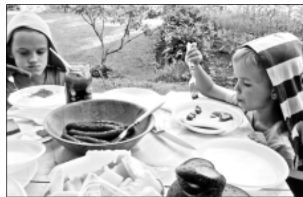
Mazbērni. Iesūtīja Daniels Kivkucāns no Balviem. Lappusi sagatavoja E.Gabranovs