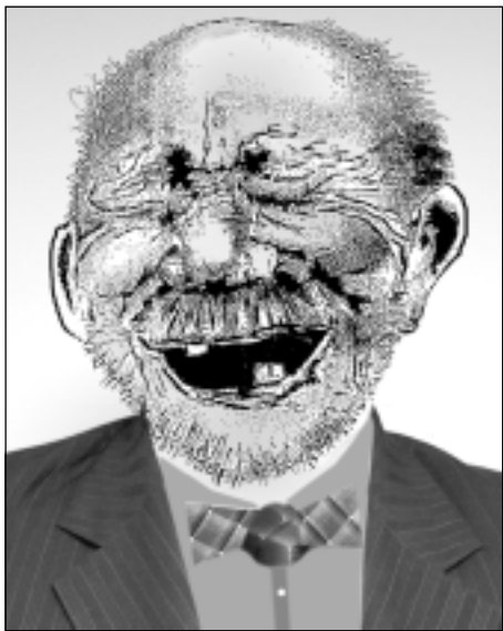
IZIDORS no Perdinavas ciema, galvenais speciālists labierīcību, kā arī daudzu citu ierīcību, izrīcību un rīcību jautājumos