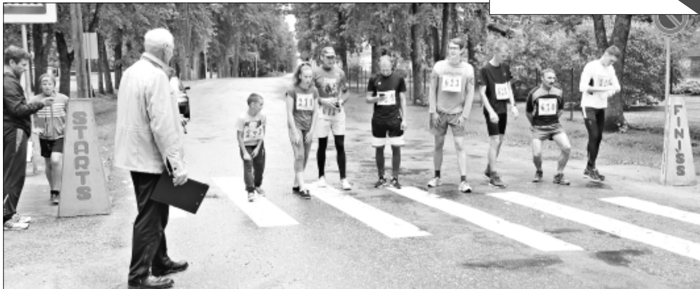
3.septembra rīts. Lai arī skrējienā apkārt Viļakas ezeram piedalījās tikai 11 sportisti, viņi bija vienprātīgi, ka nav demokrātiskāka sporta veida kā skriešana.

Lūdzam sekot informācijai LAD mājaslapā.