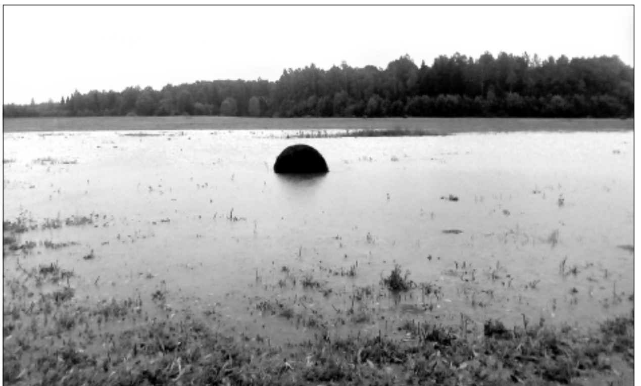
Plūdi. Iesūtīja Ilona Slucka.

Katra mēneša labākās fotogrāfijas autors saņems balvu. Fotogrāfijas var iesūtīt pa pastu – Balvi, Teātra ielā 8, LV-4501, vai elektroniski – vaduguns@apollo.lv. Pie foto obligāti norādāms vārds, uzvārds (vēlams - tālrunis).