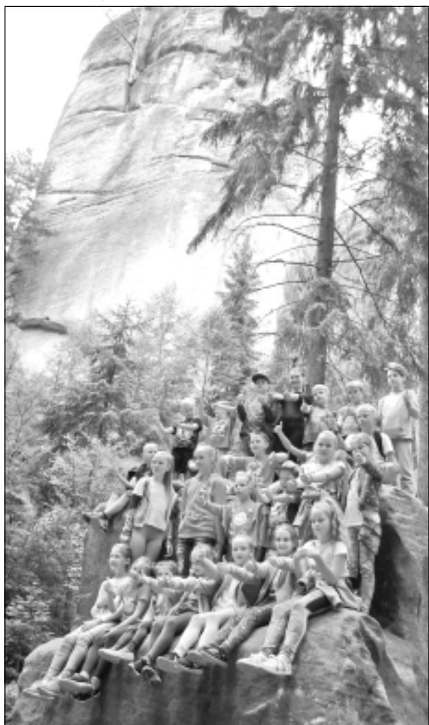
Iespaidīgi! Andršpahas dabas parkā ir ko redzēt un apbrīnot.