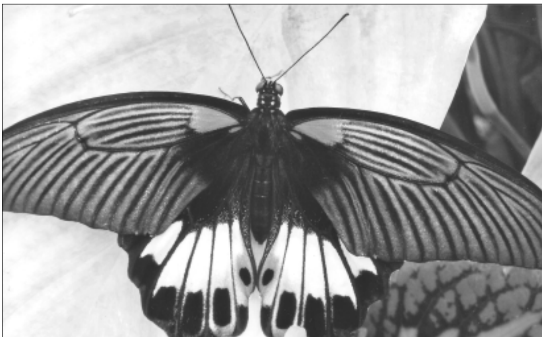
Visapkārt taureņi.

Katra mēneša labākās fotogrāfijas autors saņems balvu. Fotogrāfijas var iesūtīt pa pastu – Balvi, Teātra ielā 8, LV-4501, vai elektroniski – vaduguns@apollo.lv. Pie foto obligāti norādāms vārds, uzvārds (vēlams - tālrunis).