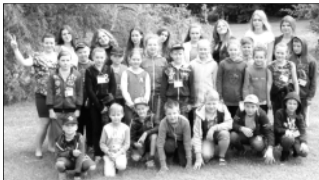
Paliec sveiks, Viļciem! Simulācijas spēles laikā katrs no šiem bērniem un jauniešiem, ieguvuši jaunu pieredzi, uz apkārt notiekošo raugās mazliet citām acīm. Uzzinājuši, cik daudz jāstrādā, lai naudu nopelnītu, viņi labāk izprot tās vērtību.