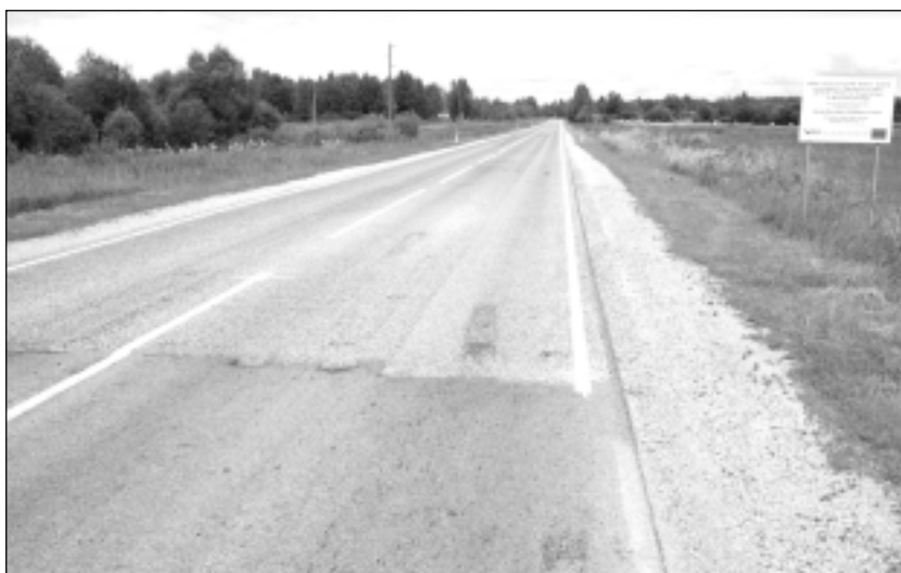
Atjaunotā ceļa seguma sākums. Tagad Kapūnes pusē pēc remontdarbiem noņemta arī ātrumu ierobežojoša zīme.

Pēc seguma atjaunošanas laikraksta “Vaduguns” redakcija saņēma kāda autovadītāja telefona zvanu, kurš jautā, kādēļ pēc remontdarbiem uz ceļa