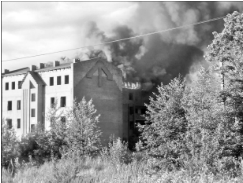
Ugunsgrēka brīdī. Valsts policija apliecina, ka cietušo nav.

Tomēr, ja kāds ar dienestiem nolēmis spēlēt spēlītes un ugunsdzēsības un glābšanas, policijas, neatliekamās medicīniskās palīdzības