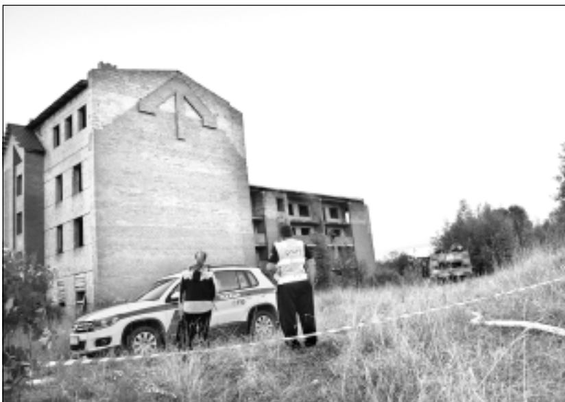
Kas vainīgs? Notikuma vietā ieradās arī Valsts policija, kuras rīcībā ir informācija par iespējamo vainīgo ugunsgrēkā.

vai citu speciālo dienestu izsaukumiem nepamatoti, atcerieties, ka par to Administratīvo pārkāpumu kodeksa 202.pantā paredzēts sods. Fiziskajām personām uzliek naudas sodu no 35 līdz 140 eiro, bet juridiskajām personām — no 140 līdz 1400 eiro. Savukārt par apzinātu informācijas izplatīšanu par nepatiesu notikumu vai apzinātu nepatiesu notikuma