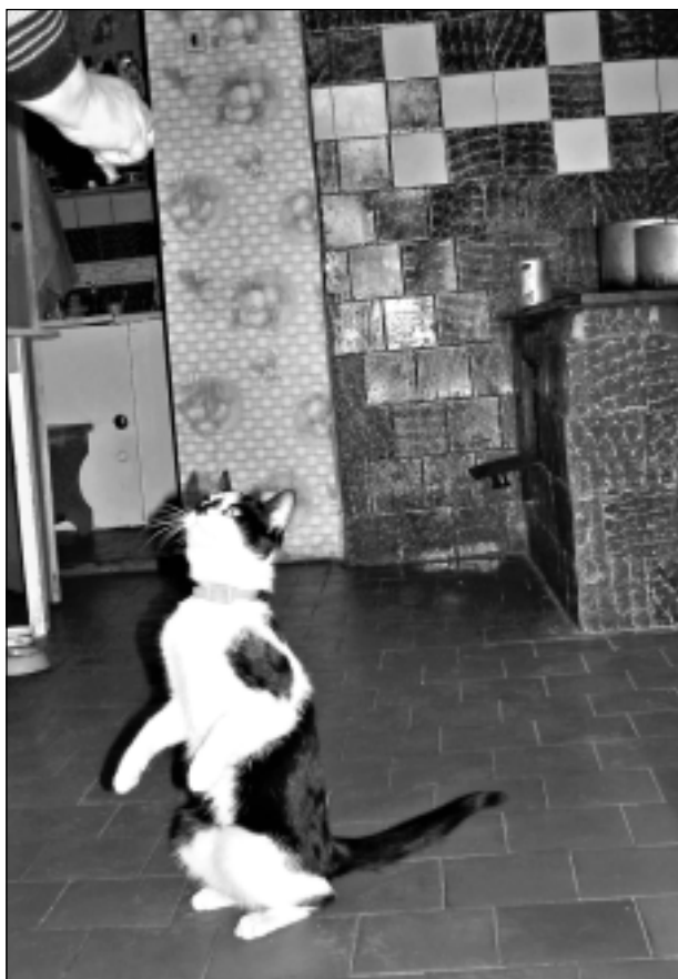
Ūšuks lūdz gardumiņu. Iesūtījis Velta Ieviņa no Krišjāņu pagasta.

Katra mēneša labākās fotogrāfijas autors saņems balvu. Fotogrāfijas var iesūtīt pa pastu - Balvi, Teātra ielā 8, LV-4501, vai elektroniski - vaduguns@apollo.lv. Pie foto obligāti norādāms vārds, uzvārds (vēlams - tālrunis).