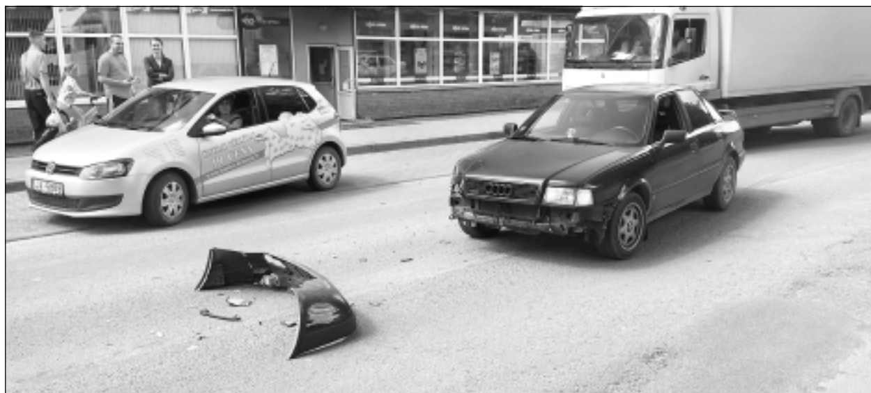
Bērzpils iela. Valsts policija informē, ka 7.jūlijā pulksten 14.55 Balvos, Bērzpils ielā, notika ceļu satiksmes negadījums. 1946.gadā dzimis vīrietis vadīja automašīnu "Opel" un sadūrās ar automašīnu "Audi", kuru vadīja 1991.gadā dzimis vīrietis. Par notikušo sastādīts ceļu satiksmes negadījuma saskaņotais paziņojums.