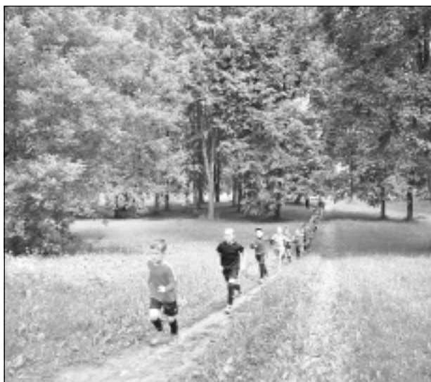
Grūti, bet nepieciešami. Otrdien mazie sportisti treniņa laikā pie upes vairoja fizisko izturību, skrienot kalnā, jo, kā zināms, futbolistam jāprot ne tikai veikli darboties ar bumbu, bet arī jāspēj būt aktīvam laukumā visa mača garumā.