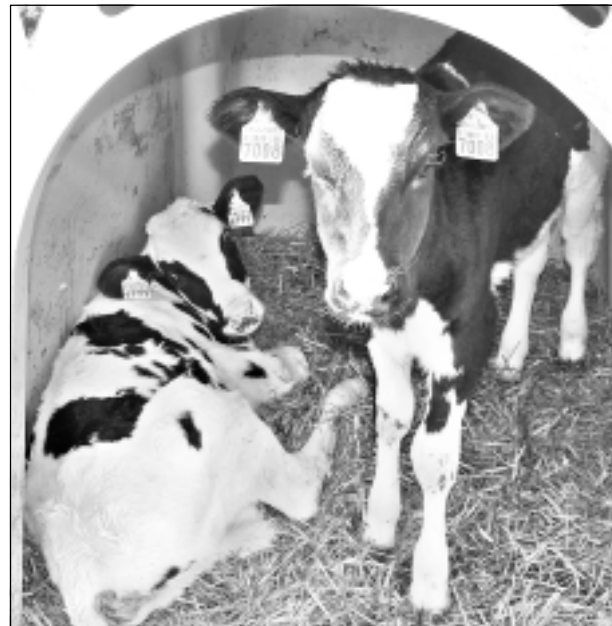
Mājīgi. Mazos teliņus bagātīgi baro ar pienu. Tad viņi aug veselīgi un attīstīti.