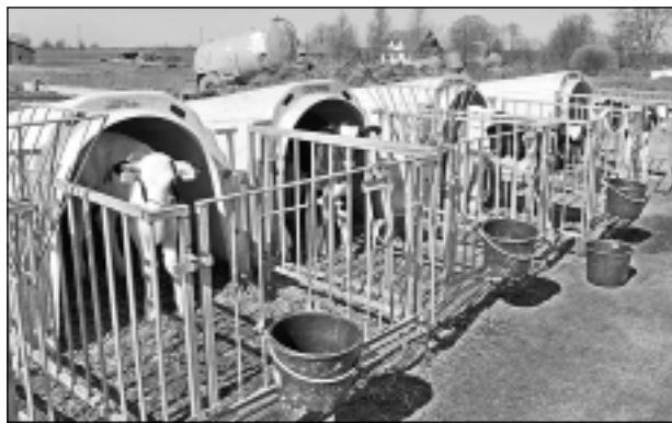
Mājiņas teliņiem. Vairāki Balvu puses lauksaimnieki atzina, ka pirmo reizi redz šādas mazo teliņu novietnes. Mājiņas ir ar jumtiņu, tādēļ ērtas un praktiskas. Ražotāji padomājuši arī par to praktisku sakopšanu. Saimnieks stāstīja, ka teliņi dažkārt tur dzīvo arī ziemas laikā.