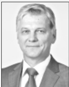
Jānis Trupovnieks - LR 12. Saeimas deputāts