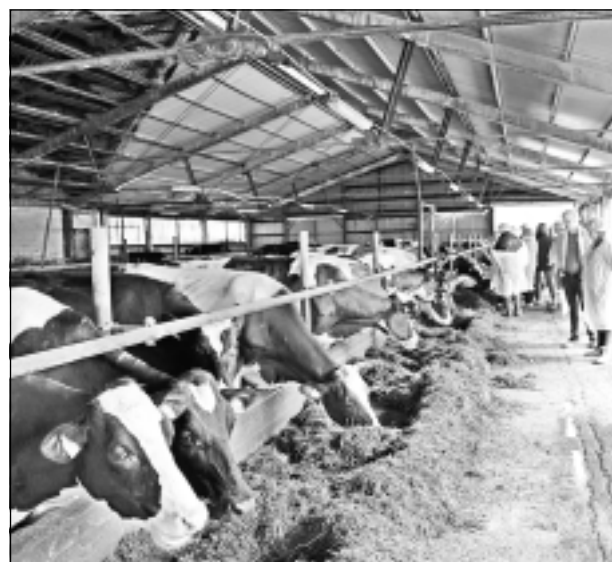
Drīz ies ganībās. Bija laiks, kad šajā saimniecībā govis visu gadu turēja iekštelpās. Tagad ceturtais gads, kopš piena devējas iet ganībās. “Tagad mums ir šāda iespēja, jo pietiek tehnikas, var vieglāk un ātrāk darīt visus darbus,” atzīst saimnieks.