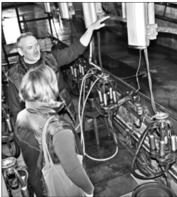
Slaukšanas zāle. Govis slauc divreiz dienā. Vienā reizē slauc astoņas govis. Ganāmpulkā pavisam ir ap 100 piena devēju. Saimnieks atklāja, ka viņiem ir arī kādas četras 13. laktācijas govis. “Kamēr lopiem laba veselība un dod pienu, žēl tikai vecuma dēļ tādās govīs izbrāķēt,” viņš teica.