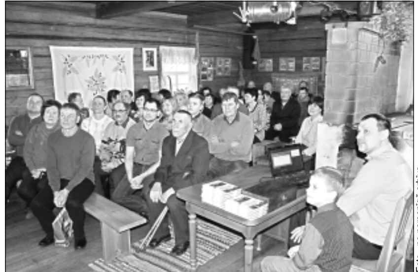
Sirsnīgā atmosfērā. Interesantā un atmiņām bagātā gaisotnē Tepeniņas ciema ļaudis pavadīja vējaino pavasara pēcpusdienu Vēršukalnā.