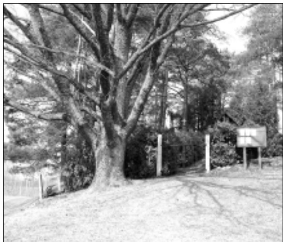
Kapu kalns. Cepures kalnā atrodas tuvējo ciemu kapsēta. Kalns ir vietējās nozīmes kultūrvēstures piemineklis. Kalns izaug, kā no zemes un kāpiens tajā ir smags. Pie kapu vārtiem aug liels, zarains ozols.

Teju pirms 10 gadiem Naudaskalna iedzīvotājs Leontijs Vizulis "Vaduguni" rakstīja: "Tik zema un līdzena vieta, kur tad te kalns un vēl Naudaskalns!" Arī nogriežoties uz Silamalu, no kalniem ne ziņas, ne miņas. Taču pusceļā parādās kalna vārda cienīgs objekts. Tā galotnē aug skujkoki, bet viena kalna mala norakta. Tas ir Pilskalns. Ja Pilskalnu no ceļa redz, tad Cepures kalnam var pabraukt garām, to nepamanot, jo skatu aizsedz krūmi.