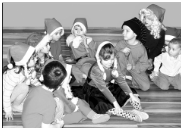
Ziemassvētku rūķi. Pirmsskolas grupas bērni svētkos pārtapuši par rūķiem. Prieks pašiem, vecākiem un audzinātājam.