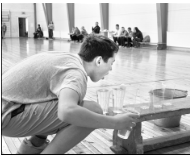
Veiklības pārbaude. Lāčplēša dienā Skolēnu padome organizē sacensības, kurās vajadzīgs gan spēks, gan veiklība un ātrums, gan erudīcija un izdoma.