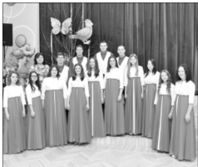
Vokālais ansamblis "Vērmelīte". Par iespēju iegādāties jaunus tērpus sirsnīgs paldies SEB bankai.