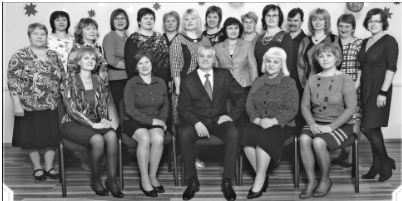
Mūsu skolotāji. Vēl daži kolēģi šoreiz palikuši aiz kadra.