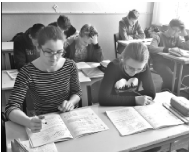
Mācīties, mācīties un vēlreiz mācīties... Laiki mainās, bet skolas galvenais uzdevums paliek tas pats - mācību darbs!