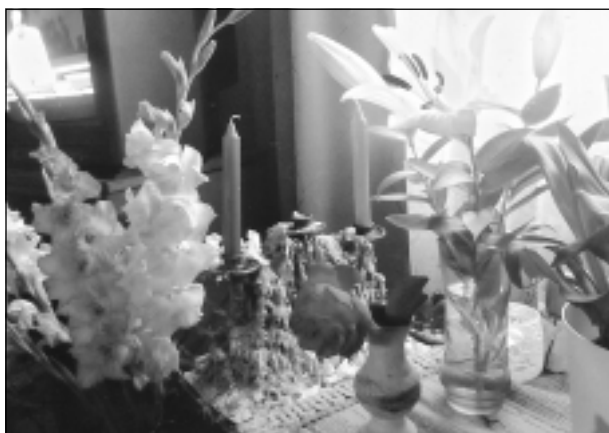
Ziedu valstībā. Iesūtīja Daniels Kivkucāns no Balviem.

Katra mēneša labākās fotogrāfijas autors saņems balvu. Fotogrāfijas var iesūtīt pa pastu – Balvi, Teātra ielā 8, LV-4501, vai elektroniski – vaduguns@apollo.lv. Pie foto obligāti norādāms vārds, uzvārds (vēlams - tālrunis).