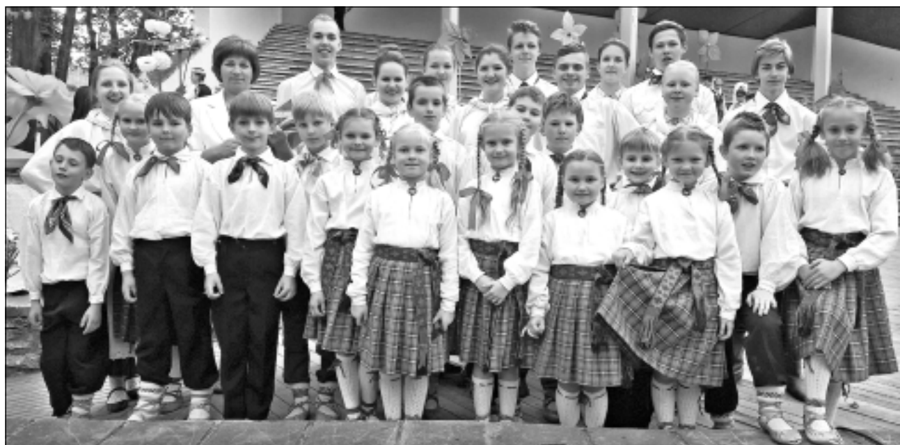
Baltinavas deļotāji. Sākumskolas un jauniešu tautu deju kolektīvi 2016.gada maijā piedalījās starpnovadu radošajā festivālā Balvos.