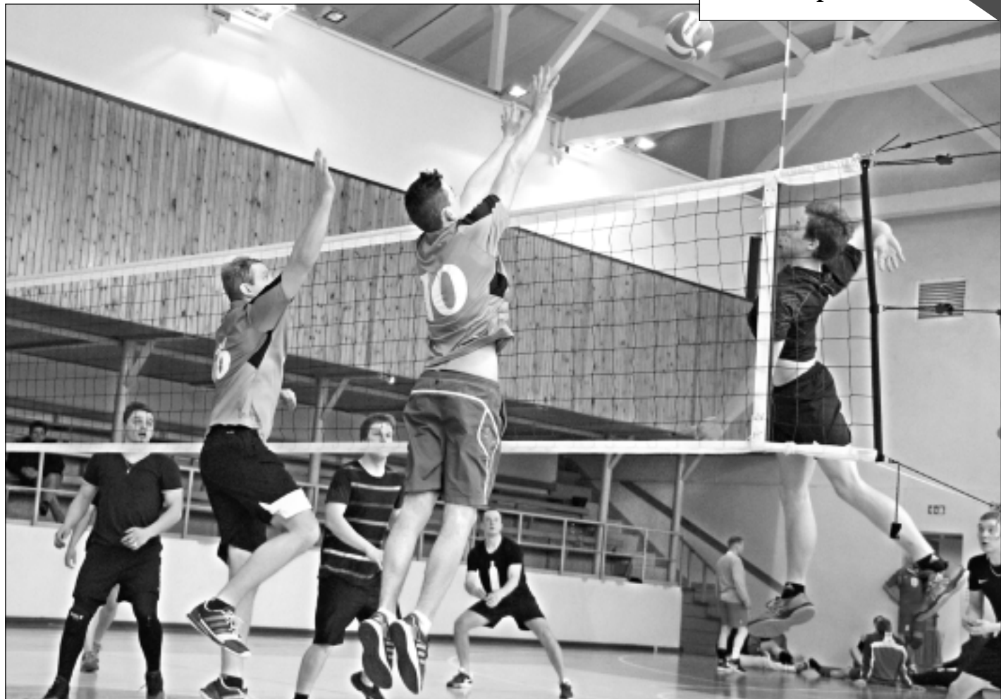
Dramatisks mačs. Vīriešu grupas komandas savstarpējās attiecības brīvdienās skaidroja Balvu pamatskolas sporta zālē. Nervozs un dramatisks mačs izvērās starp bērzpīliešiem un baltinaviešiem (foto), kurā tikai piektajā setā veiksmē uzsmaidīja bērzpīliešiem.

Atgādinām, ka 11.februārī laukumā pie Balvu Kultūras un atpūtas centra notiks pirmais šī gada lauku labumu tirdziņš, kurā varēs iegādāties dažādus lauku labumus un amatniecības izstrādājumus no zemniekiem, mājražotājiem un amatu meistariem.