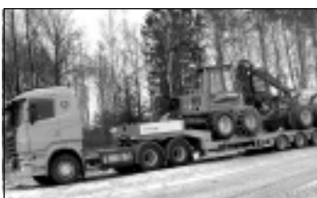
Treilera pakalpojumi. Tāl. 29113399.

JAUNUMS! 6-KAMERU LOGI! Mitruma savācēji. Vairāk nekā 20 ārdurvju modeļi. Balvi, Bērzpils 2a. Tāl. 26343039, 64521166.