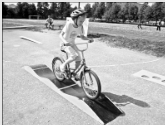
Noslēdzies "Jauno satiksmes dalībnieku forums 2013" Balvos.