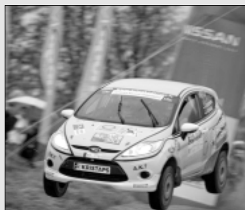
Pedalās Talsu rallijā.