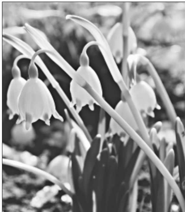
Sniegpulkstenīši. Iesūtīja Rita Keiša.

Katra mēneša labākās fotogrāfijas autors balvā saņems žurnālu komplektu. Aprīļa tēma: "Saulītes iedvesmots". Fotogrāfijas var iesūtīt pa pastu – Balvi, Teātra ielā 8, LV-4501, vai elektroniski – vaduguns@apollo.lv . Pie foto obligāti norādāms vārds, uzvārds (vēlams - tālrunis).