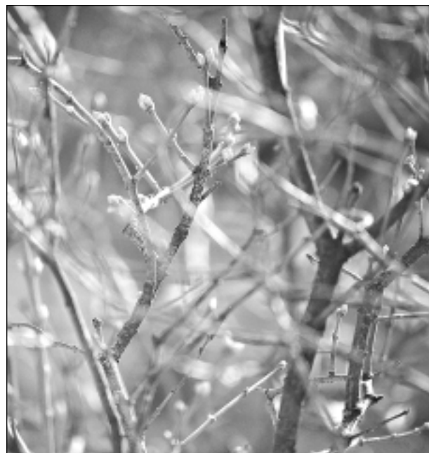
Parādās pirmais zaļums. Iesūtīja Zane Jermacāne.