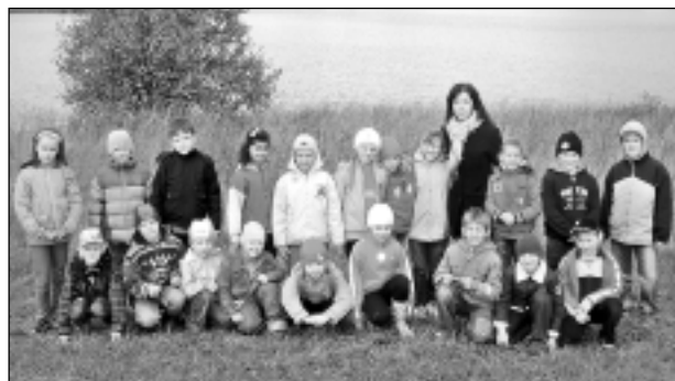
Iepazīst Baltinavas novada ezerus. Pārgājienos sākumskolas klašu skolēni iepazīst savu novadu, bet mācību ekskursijās, apceļojot Latviju, dodas visas klases. Katru gadu "Labākās liecības" konkursa uzvarētājas klases (divās klašu grupās) balvā iegūst vienas dienas bezmaksas ekskursiju pa Latviju.