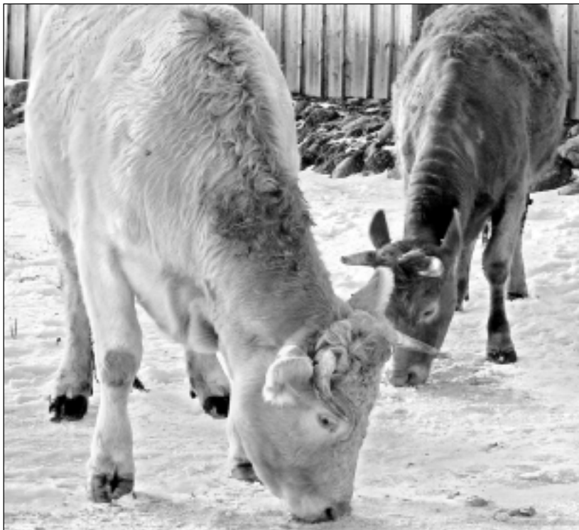
Nesalst. Gaļas lopu ir pieraduši dzīvot ārā arī sala laikā.

Sala laikā dažkārt gadās izēdināt sasuļšus sakņaugus, kas īpaši kaitīgi grūšiem dzīvniekiem. Savukārt atlaidināti un ilgi glabāti sakņaugi vai to lapas var izraisīt saindēšanos ar nitrātiem.