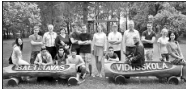
Baltinavieši un holandieši kopā. 2011. gadā Almelo skolas (Nīderlande) projekta ietvaros būtiski uzlabots skolas nodrošinājums ar datoriem. Tagad katrā mācību telpā ir arī pastāvīgs interneta pieslēgums.