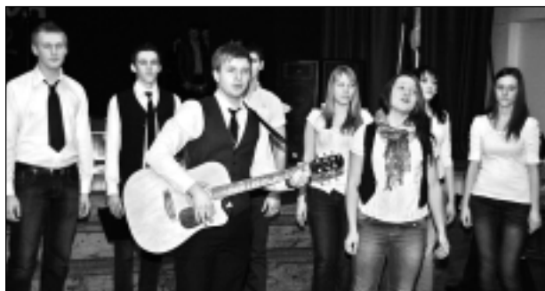
"Vērmelīte". Vokālais ansamblis ir skolas un visas Baltinavas zīmols daudzos svētkos, arī latgalešu jauniešu pasākumā - večeirkā "Vasali Baļtinovā!" .

Informācija par skolu: Baltinavas vidusskolas avīzē "Skolas Soma", Baltinavas novada mājas lapā www.baltinava.lv - sadaļā "Izglītība" - "Baltinavas vidusskola".