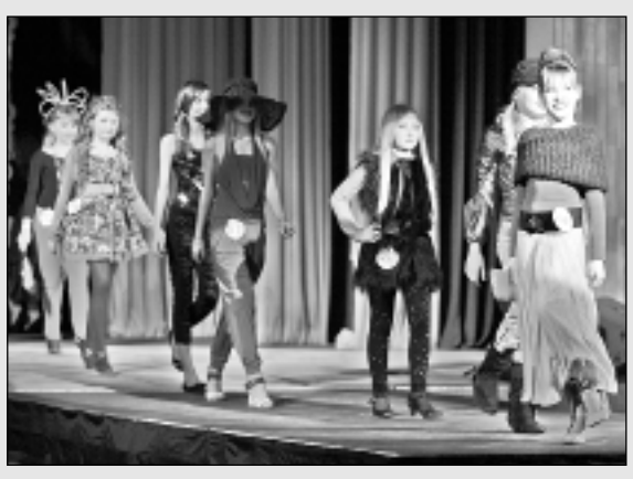
Modes festivālā "Pa modes pakāpieniem" vērtēja ne tikai tērpus...