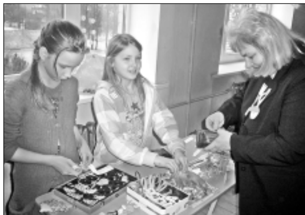
Ziemassvētku tirdziņš. Šajā tirdziņā, kas kļuvis par tradīciju, skolēni tirgojas ar pašceptiem pīrāgiem, cepumiem, vafelēm, medu, svecēm, pašu darinātiem rotājumiem, apsveikuma kartītēm un daudz ko citu.