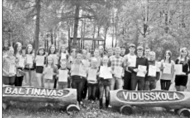
Prieks par sasniegumiem. Mācību priekšmetu olimpiāžu un konkursu godalgoto vietu ieguvēju kopbilde mācību gada noslēgumā (2011. gada maijs). Baltinavas novada pašvaldība rada iespēju šo skolēnu materiāli stimulēšanai.

Atbildīgais par lappusi - IMANTS SLIŠĀNS, tālr.: 26522144, 64521322, e-pasts: baltinava-vsk@inbox.lv ; fotogrāfijas no Baltinavas v-skolas un "Vaduguns" arhīva