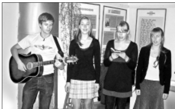
Apzinām sava novada kultūras mantojumu. Abrenes tautas tērpu Baltinavas Novada muzejā prezentē Baltinavas vidusskolas aušanas pulciņš.