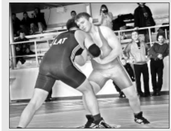
Grieķu - romiešu cīņas sacensības Balvos.