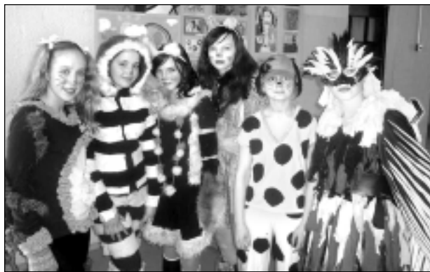
"Alise Brinumzemē". Baltinavas vidusskolas meitenes katru gadu piedalās modes skatēs, ko organizē Balvu Amatniecības vidusskola.