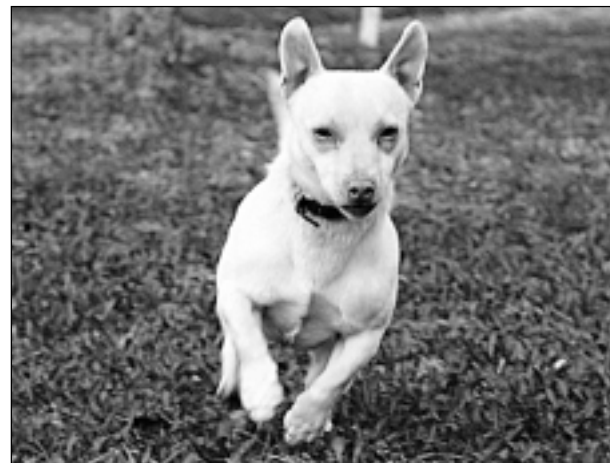
Saimnieks.