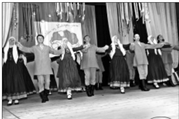
Dejo "Dēka". Vidējās paaudzes deju kolektīvs "Dēka" skatītājus iepriecināja ar divām dejām "Ai, zaļa birtaliņa" un "Rūnu deja".