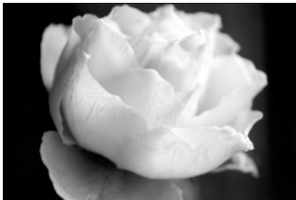
Skaistums, kas priecē.

Katra mēneša labākās fotogrāfijas autors balvā saņems žurnālu komplektu. Decembra tēma "Labam fotogrāfam nav sliktu foto". Fotogrāfijas var iesūtīt pa pastu - Balvi, Teātra ielā 8, LV-4501, vai elektroniski - vaduguns@apollo.lv. Pie foto obligāti norādāms vārds, uzvārds (vēlams - tālrunis).