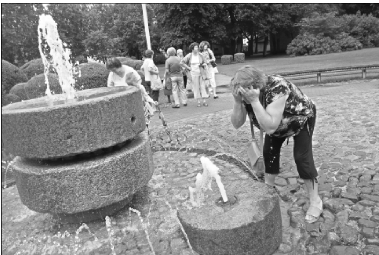
Dzirnakmens strūklaka. Tā veidota no istiem dzirnakmeņiem, kas simbolizē kādreiz laukumā darbojušās dzirnavas. Strūklakas ūdens attēlu veido 33 atšķirīgas formas ūdens strūklas.

Redakcija atvairina visiem, kurus "Cilvēkziņas" aizvainojušas vai aizvainos