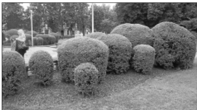
Krūmu formas. Savulaik Ventspilī bija daudz papeļu. Kad pienāca laiks tās nozāgēt, ventspilnieki noorganizēja papeļu mākslas simpoziju un mākslinieki radīja skulptūras, kas joprojām rotā vienu no zaļajiem laukumiem. Savukārt parkā, kur auga ļoti veci un neglīti koki, izmēģināja to formēšanu (attēlā). Arboristu vidū gan valda uzskats, ka koku sēdināšana ir to kropļošana.