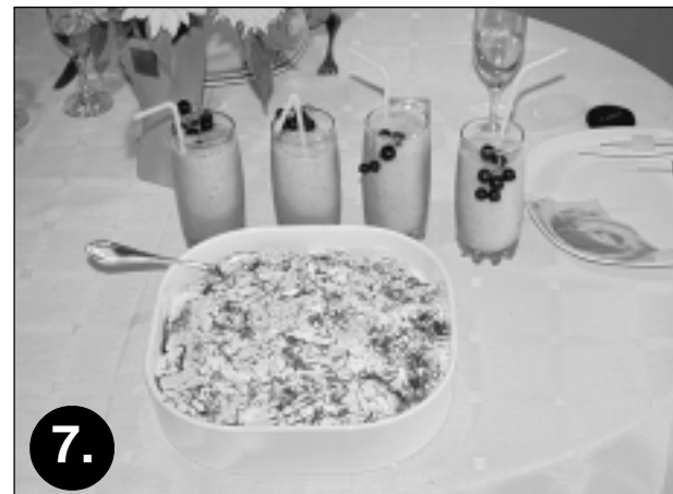
7. Labu apetīti! Pabeidzot gatavot baklažānu kārtojumu, ēdienam pēc gaumes var pievienot zaļumus, piemēram, pašu dārzā audzētas dilles.