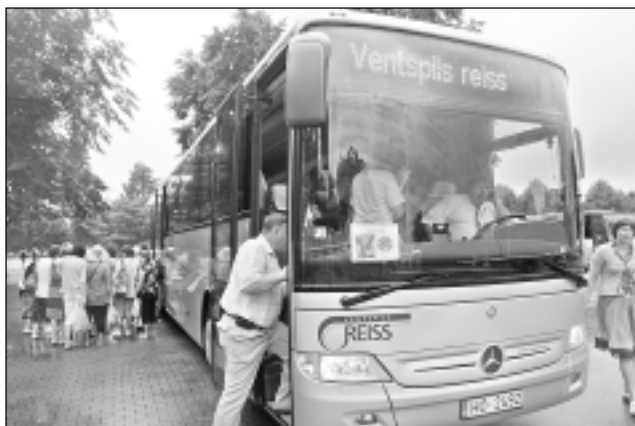
Brauc un skaties. Ventspilī daudzas lietas radītas, ņemot vērā iedzīvotāju idejas, ierosmes un kritiskās piezīmes. Ciemiņus laipni aicina sēsties vietējos, modernajos autobusus un apskatīt pilsētu.