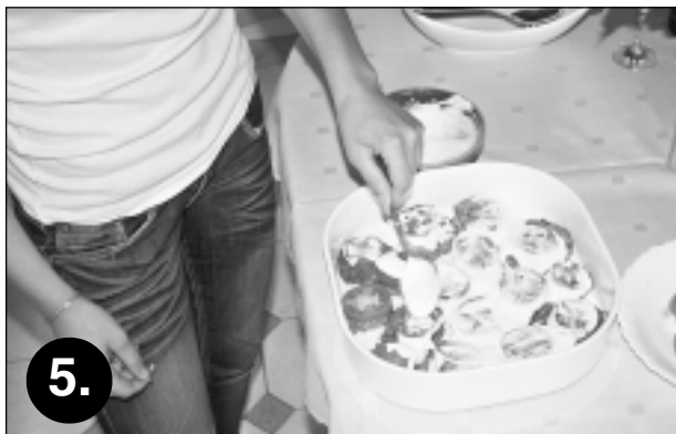
5. Ēdienu gatavo trīs kārtās. Kad baklažāns nomizots, sagriezts ripiņās, saklapēts un apcepts, traukā sāk veidot pirmo baklažānu šķēliņu kārtu, ko pārklāj ar tomātiem un pārlej ar mērci, kura pagatavota no krējuma un majonēzes, klāt pievienojot ķiploka daiviņu. Tradicionāli veido trīs ēdiena kārtas.