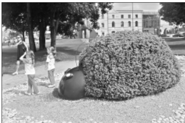
Ziedu mārītes. Trīs puķu skulptūras. Mārītes ir 2-2,5 metri garas, 0,75 - 1,5 metri augstas un 1,3 - 2 metri platas. Izmantoti aptuveni 1000 puķu stādi.