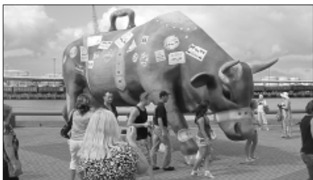
Milzu govs Ventmalā. Ventspils nav iedomājama arī bez dažādu krāsu un izmēru govīm, kas kļuvušas par tās simbolu.