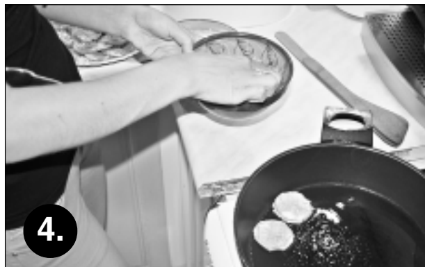
4. Jāapcep pannā. Pirms baklažānu ripiņu likšanas pannā, tās, līdzīgi kā gatavojot karbonādi, apviļā miltos un olās, pievienojot sāli un piparus. Cep aptuveni 10 minūtes.