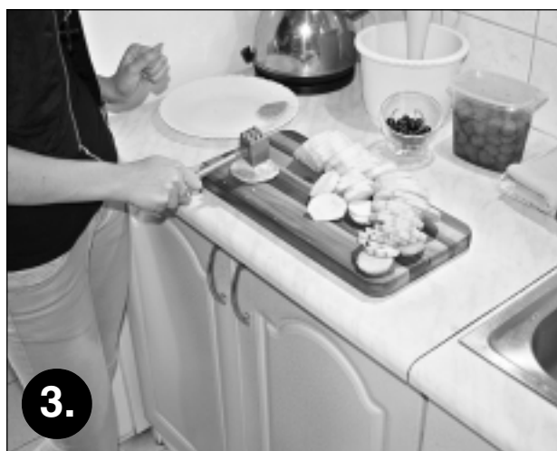
3. Dārzeņi saklapē. Baklažānu jāsaklapē, lai dārzena ripiņas kļūtu mīkstākas un sulīgākas.