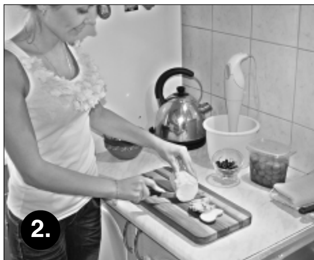
2. Sagriež ripiņās. Nomizoto baklažānu sagriež vienādās ripiņās, lai, vēlāk ēdienu veidotu kārtās.