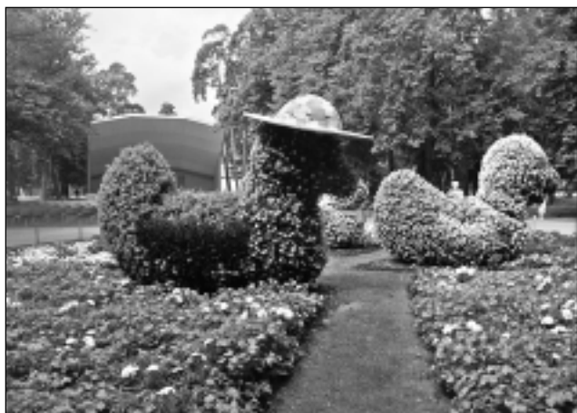
Pīļu ģimene. Viena no lielākajām ziedu skulptūrām: pīļu tēvs ar cepuri, pīļu māte ar krellēm un pīļu mazulis. Skulptūrās šovasar izmantoti 1750 puķu stādi.