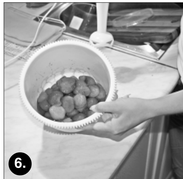
6. Saputo kokteiļi. Maltītes papildināšanai var izvēlēties dažādus dzērienus. Lielisks risinājums ir banānu un zemeņu kokteilis, kuru pagatavo no piena, saldējuma, zemenēm un banāniem.

3 banāni 350 gramu zemeņu piens, saldējums