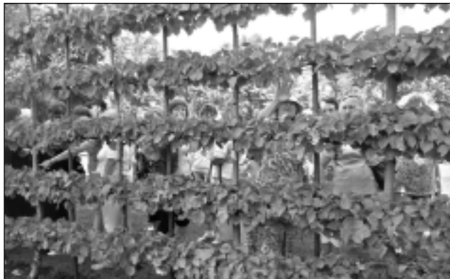
Dzīvžoga siena. Ar šādu no liepām veidotu neparasta izskata sienu skvērā atdalīta saimnieciskā zona - garāžas no reprezentācijas laukuma pie laulību ceremoniju nama.