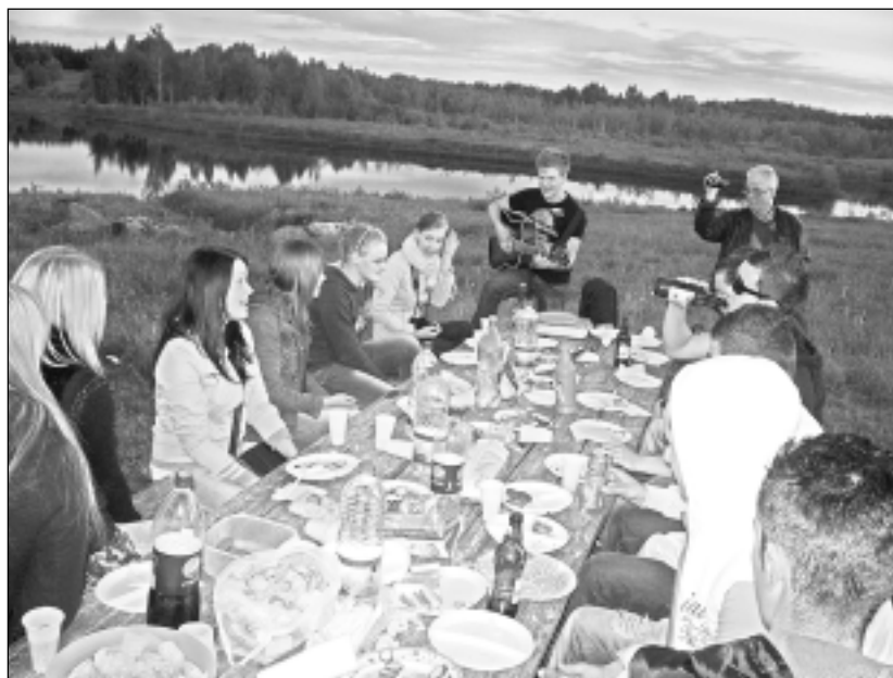
Atpūtā. Baltinavā ciemiņi no Nīderlandes paguva ne vien pastrādāt, bet arī labi atpūsties.

Piektdien, pabeiguši darbu, ārzemju viesi piedalījās Baltinavas jauniešu organizētajās sporta aktivitātēs, bet sestdien ciemiņi devās tālāk - apskatīt mūsu valsts galvaspilsētu Rīgu.