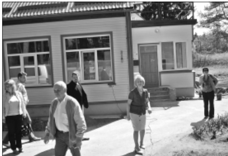
Sadarbības iestāde - Veselības ekonomikas centra darbinieki apmeklē neatliekamās palīdzības telpas Viļakā. Parka ielā 2 ir rekonstruētās Vidzemes reģiona Viļakas Neatliekamās medicīniskās palīdzības dienesta telpas.