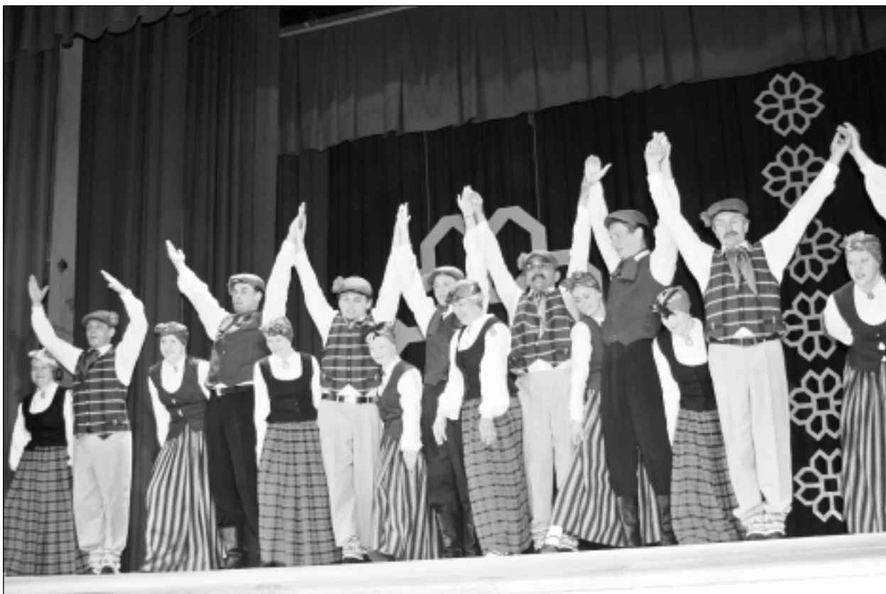
Borisovas - Žiguru apvienotā deju kopa. Viņi izpildīja dejas "Nagaru leiceņu" un "Miļā Māra man iedeva jeb Raibā govs".