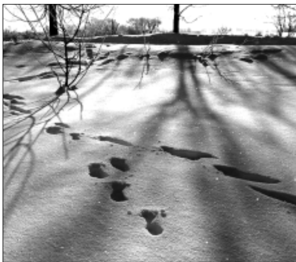
Pēdas sniegā.

Katra mēneša labākās fotogrāfijas autors balvā saņems žurnālu komplektu. Aprīļa tēma "Daba ir bezkaislīga". Fotogrāfijas var iesūtīt pa pastu - Balvi, Teātra ielā 8, LV-4501, vai elektroniski - vaduguns@apollo.lv. Pie foto obligāti norādāms vārds, uzvārds (vēlams - tālrunis).