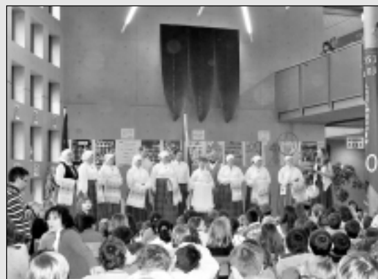
"Egles" Luksemburgā satiekas ar "Dzērvēm".