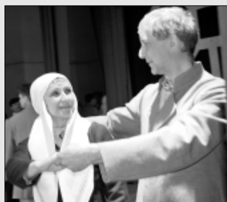
Deju skatē sevi pierāda četrpadsmit kolektīvi.