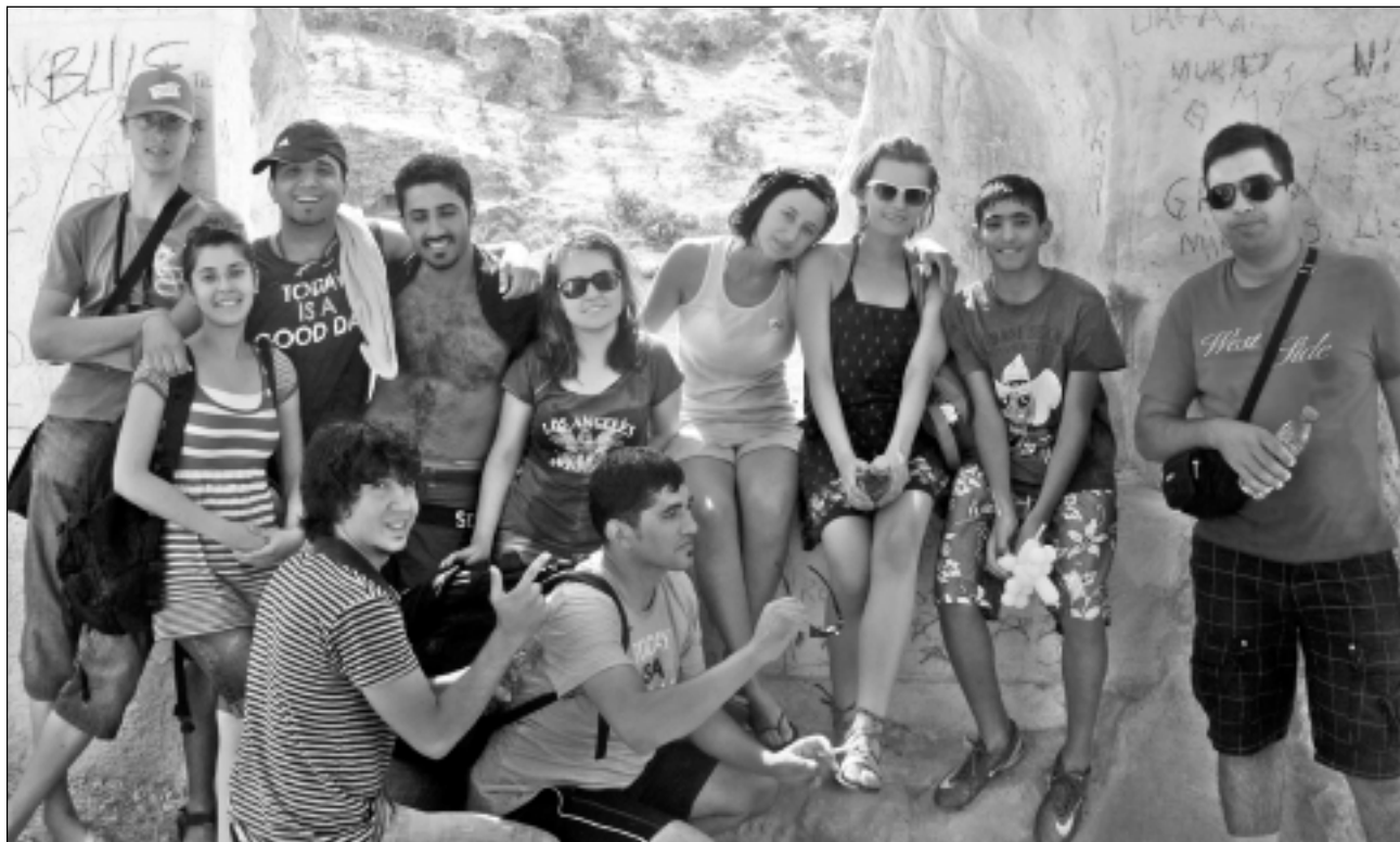
Visi kopā. Eiropas brīvprātīgie kopā ar turku kolēģiem pozē Rumkalē pie Eifratas upes. Brīdī, kad tapa šis kadsrs, laukā valdīja + 50 grādu svelme.