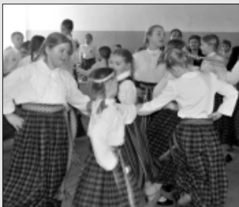
Dzied un dejo Upītē.