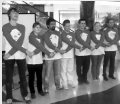
Balvu pagasta jaunieši kopā ar citiem Eiropas brīvprātīgajiem stāsta turkiem par AIDS.