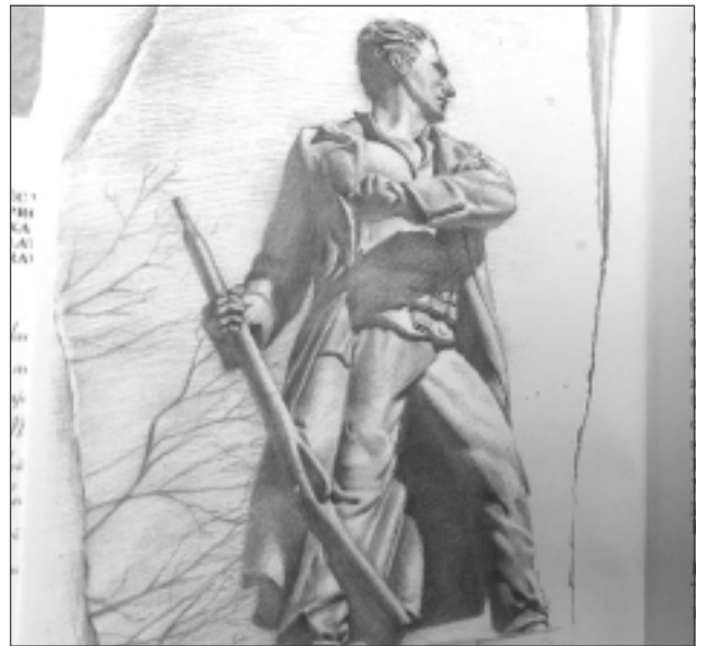
Darbi. Viena no Astras zīmētajām ilustrācijām Andra Tjuniša dzejoļu grāmatai “Latvija – United Kingdom. Ar tiesībām sarakstīties” un svētku noformējums pie Balvu Kultūras un atpūtas centra.