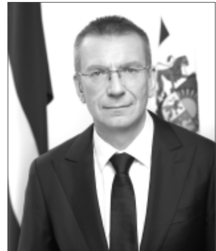
EDGARS RINKEVIČS , Latvijas Valsts prezidents

Mūsu Latvija ir dārgums. Mūsu Latvija ir skaistums. Mūsu Latvija ir atbildība. Mūsu brīvība ir atbildība. Mūsu pašu atbildība. Cik lielus darbus darīs mūsu rokas, prāti un sirdis, tik liela būs mūsu Latvija. Paldies katram Latvijas patriotam, kurš mūsu valsti šogad ir darījis stiprāku, drošāku un lielāku. Sveicu Latvijas Republikas proklamēšanas 106.gadadienā!