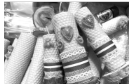
Sveces. Marija darina bišu vaska sveces un sarkanbalt-sarkanos toņos cep svētku kūkas.

✧ Latvijai un īpaši pierobežai vēlu izturību, iedzīvotājiem – cienīt sevi un tuvākos, mazāk pārdzīvot par to, ko nevaram ietekmēt, bet paskatīties apkārt un mēģināt izdarīt ko mazu, labu, kas ir katra spēkos. Arī es tā daru un cenšos dzīvot līdzsvarā ar sevi un dabu.