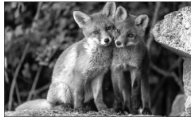
Fotogrāfijas. Biškopim ir ne mazums fotogrāfiju ar bitēm un meža iemītniekiem, piemēram, lapsām, jentosuņiem, vilkiem un citiem dzīvniekiem.

✧ Pats galvenais, ko novēlu Latvijai un mums visiem – mieru! Lai Latvija vienmēr būtu tik skaista un bagāta ar savu neatkarīgo floru un faunu. Lai mūsu zeme mūs vienmēr pozitīvi pārsteidz, bet mēs centīsimies to saudzēt un mīlēt! Novēlu mums būt patiesi laimīgiem gan fiziski, gan garīgi mūsu dzimtenē, mūsu Latvijā! Lai miers, gaišums un mīlestība ienāk katrā mājā mūsu valsts dzimšanas dienā un paliek uz palikšanu.